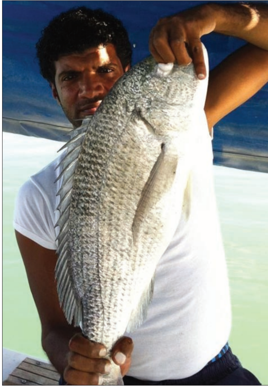
وهذا سبيطي لعيون الشباب