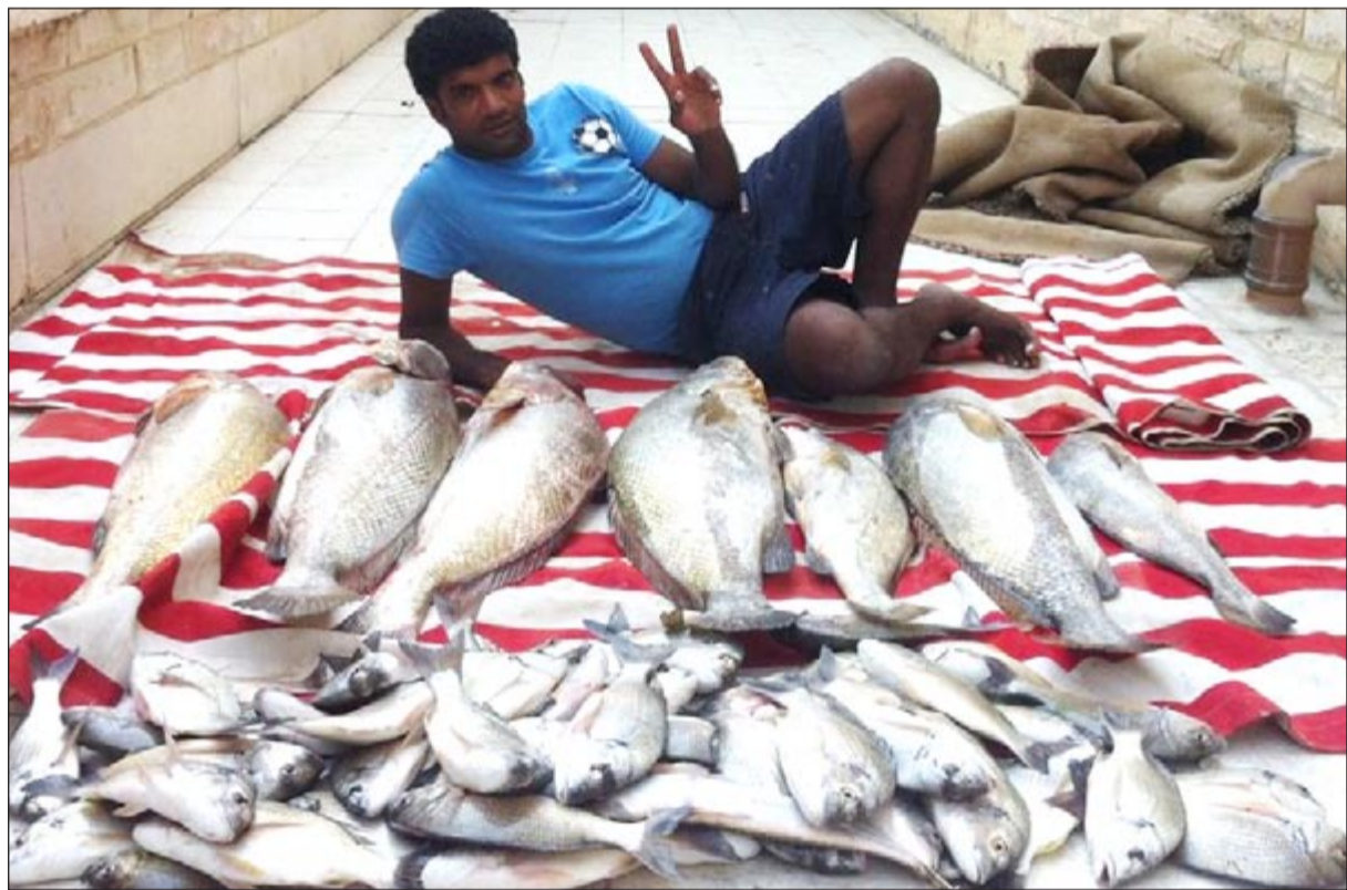
لحظة الانتصار مع مجموعة صيد احدي الرحلات

اضاعها صاحبها، ثانيا المشايك التي ترمى بالجون من قبل بعض الإخوان رب يهديهم، ثالثا التلوث «وهذا بلا أبوك يا عقاب» فهو اخطر ما دمر بحرنا وقلل نسبة الصيد وبشكل كبير جدا، ولو لاحظ اخي الكريم اذهب الى سوق السمك وقم بشراء اي نوع من الاسماك وافتح خباشيمها ستلاحظ ان هناك لونا اسود على اطراف الخياشيم وهذا هو الدمار، نعم التلوث وصل الى بطوننا والله المستعان واكثر الامور التي نراها الآن من تدمير هو قيام بعض الجنسيات الآسيوية بالدخول الى البحر بالطراد دون مراعاة صاحب الطراد له وقبامه بالصيد بأكثر من طريقة سواء كان بالمشايك أو القراقير أو الطاروف وبأي شيء يخطر بباله فمن «أمن العقوبة أساء الأدب»، وهذا الحاصل وقد يأتي يوم من الأيام ونسمع أنهم قاموا بصيدون الأسماك بطريقة «الديناميت» وهذا في اعتقادي وارد جدا بالأيام القادمة.