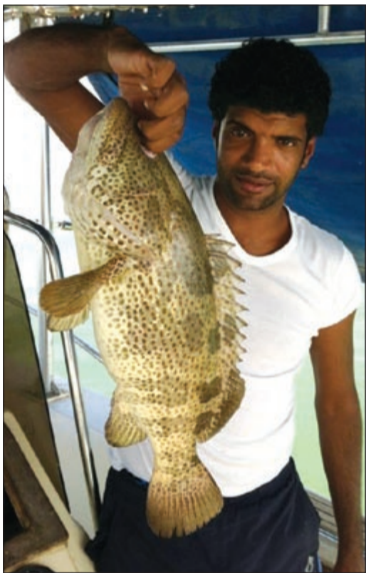
يا سلام على الجالول