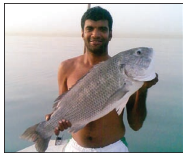
شرايكم بهذا السبيطي العجيب