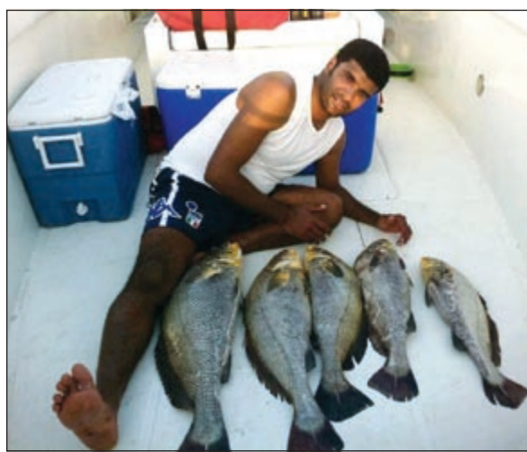
غرامي دائما الشماهي

● حبسي للبحر كان اساسا سببه الاسماك والإسماك بها ولا اعتقد انه في يوم من الأيام سيقلي جبي وعشقي للأسماك أبدا فهو بازدياد دائما وأبدا، فألحداق اصلا بعشقي الزفرة فهي بمثابة عطر حفشسي له ولا يرتاح حتى تتشبع ملايسه برائحة هذا العطر الجميل اما الاسماك التي جيبها دائما يزيد ولا ينقص فهي السبيطي والشعم والنوع الثالث هو من سيطر على فكري بالوقت