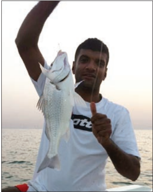
واحلي نقرور وصلحه