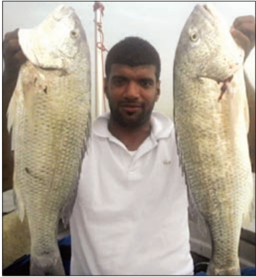
السبيطي الطفل المدلل

«بحري» صفحة تستقبلكم كل أربعاء بكل ما يعنى بالبحر وهواية الحداق ● اسبوعيا نسلط الضوء على هذه الهواية، ونستقبل مشاركاتكم وصوركم وآراءكم. للتواصل معنا عبر هذه الصفحة أرسلوا تعليقاتكم على الايميل: bahri@alanba.com.kw ● اعداد: هادي العنزي