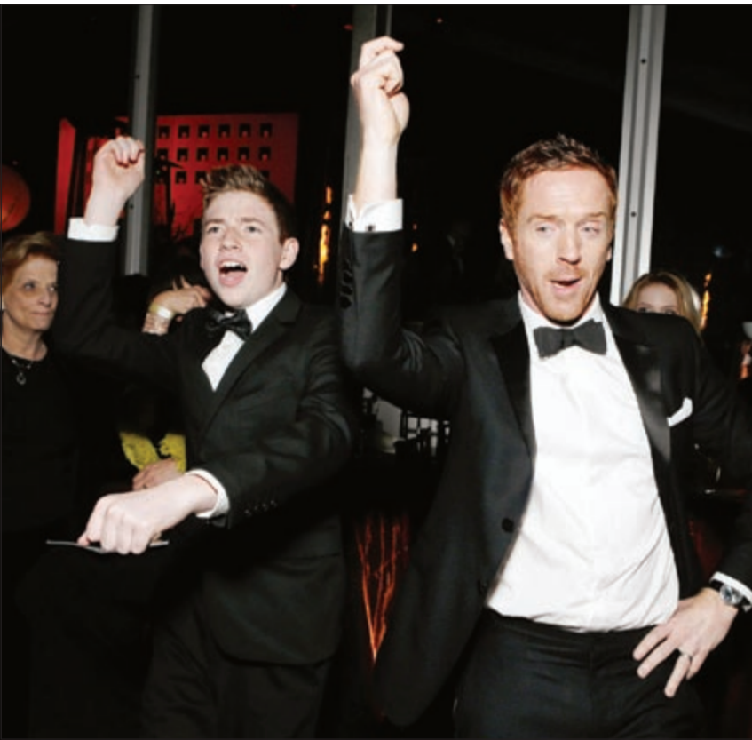
فرحة ورقصة في حفل غولدن غلوب