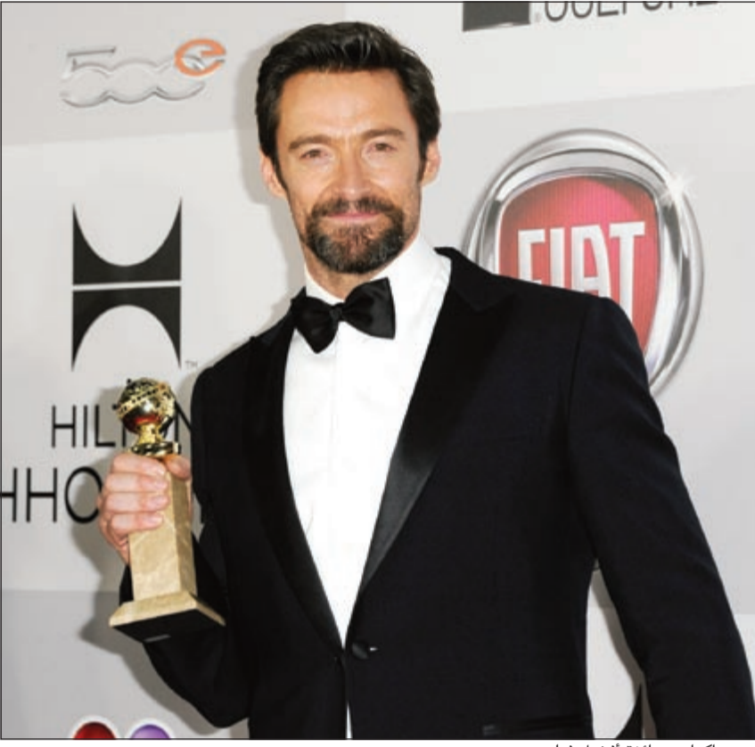
هيو جاكمان وجائزة أفضل فيلم

ويتنافس أعضاء تلك الجماعة حول من يرتدي منهم العمامة الأكبر، خاصة في عيد الحصاد أو «ماغي ميلا»، الذي يواكب ذكرى معركة خيندارا التي دارت بين الجيش المغولي الغازي وملك السيخ جورو العاشر، جوبيند سينج جي، ويسعون في عيدهم إلى ممارسة أساليب القتال المعروفين بها باسم «جاكتا»، وهو فن من فنون الدفاع عن النفس بالأسلحة، كما أنهم يمارسون خلاله رياضة الفروسية باستخدام الرماح فيما يعرف بـ «الوفاثي». «نيهانج» هي كلمة فارسية تعني «التماسيح»، وتطلق على المحاربين في جيوش المغول، حيث كانوا يقاتلون بشراسة كـ «الزواحف المتوحشة».