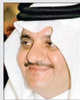
الأمير سعود بن نايف

من الأمير عبدالعزيز بن ماجد بن عبدالعزيز. ونقلت الوكالة عن المرسوم الملكي «يعفى صاحب السمو الملكي الأمير محمد بن فهد بن عبدالعزيز آل سعود أمير المنطقة الشرقية من منصبه