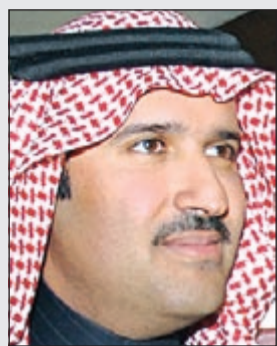
الأمير فيصل بن سلمان

بناء على طلبه، وأضاف «يعفى صاحب السمو الملكي الأمير سعود بن نايف بن عبد العزيز آل سعود رئيس ديوان سمو ولي العهد والمستشار الخاص لسموه من منصبه ويعين أميراً للمنطقة الشرقية». وقال مرسوم ملكي نقلته الوكالة السعودية «يعين صاحب السمو الملكي الأمير فيصل بن سلمان أميراً لمنطقة المدينة المنورة». وقد أعرب الأمير فيصل بن سلمان عن امتنانه وتقديره لخادم الحرمين الشريفين بمناسبة صدور الأمر الملكي الكريم بتعيينه أميراً لمنطقة المدينة المنورة.