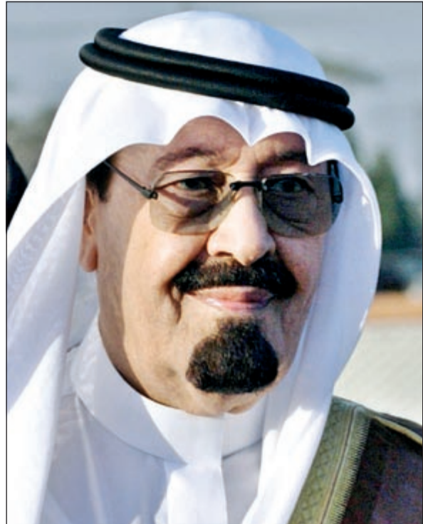
خادم الحرمين الشريفين الملك عبدالله بن عبدالعزيز

يتسلم منصبه سفيراً لخادم الحرمين في مدريد. ثم شغل منصب مساعد وزير الداخلية للشؤون العامة، وتلاها تعيينه رئيساً لديوان ولي العهد ومستشاره الخاص، ليعود أخيراً أميراً على المنطقة الشرقية السعودية. أما الأمير فيصل بن سلمان الحاصل على شهادة الدكتوراه فأتى من الوسط الأكاديمي حيث عمل عضواً لهيئة التدريس في كلية العلوم السياسية بجامعة الملك سعود قبل أن يصبح رئيساً للمجموعة السعودية للأبحاث والتسويق، ليتم اختياره أخيراً أميراً لمنطقة المدينة المنورة.