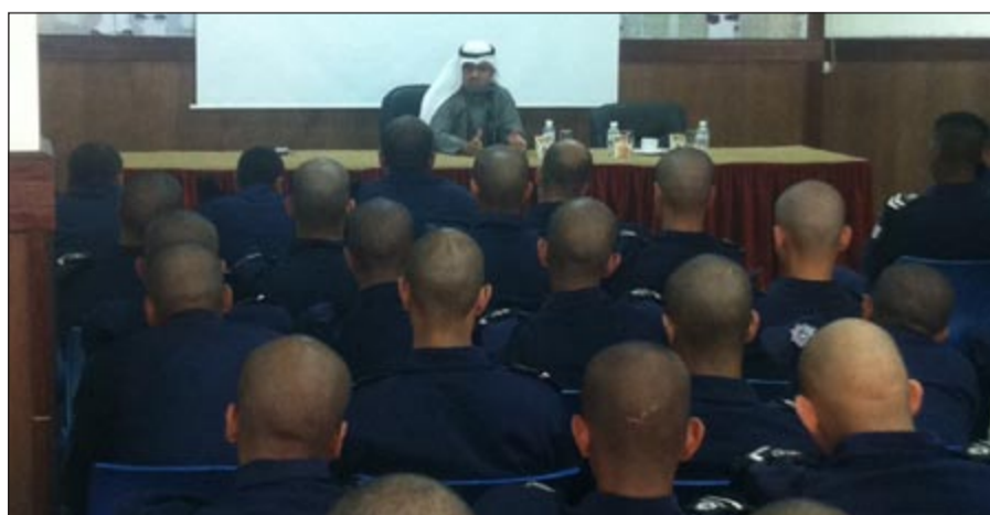
جانب من المحاضرة

المنعنية للحد من ارتكابها والتي أصبحت مشكلة تؤرق دول العالم بعدما تسببت في حصد الكثير من الأرواح.