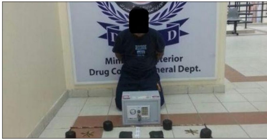
المتهم وامامه المضبوطات

ناري مع ذخيرة حية، وبمواجهة المواطن اعترف بما نسب إليه، وتم إحالته والمضبوطات إلى جهة الاختصاص.