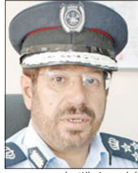
اللواء يوسف الأنصاري

فرانكفورت). وسيقام المعرض في مركز دبي التجاري العالمي خلال الفترة من 15 إلى 17 يناير 2013 ويتوقع قسم الدراسات والأبحاث في «إيبوك ميسي فرانكفورت»، نمو سوق أدوات ومعدات مكافحة الحرائق في منطقة الشرق الأوسط بشكل ملحوظ، حيث يتوقع ارتفاعا يصل إلى مليار و125 مليون دولار في العام 2013.