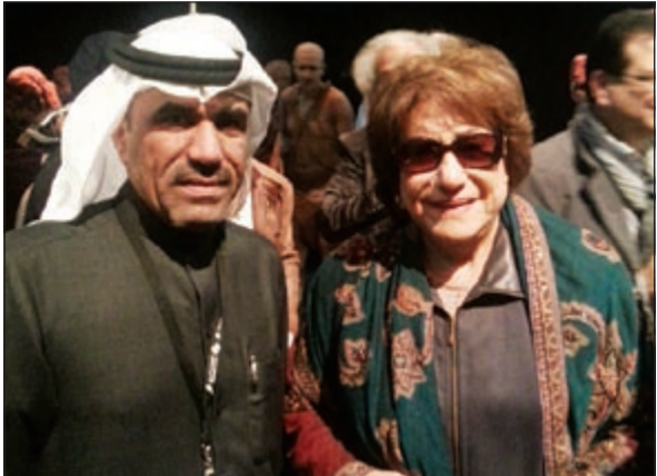
الزميل مفرح الشمري مع الفنانة القديرة سميحة أيوب

سميحة أيوب لـ «الأنباء»: أبهرني «صهيل الطين»