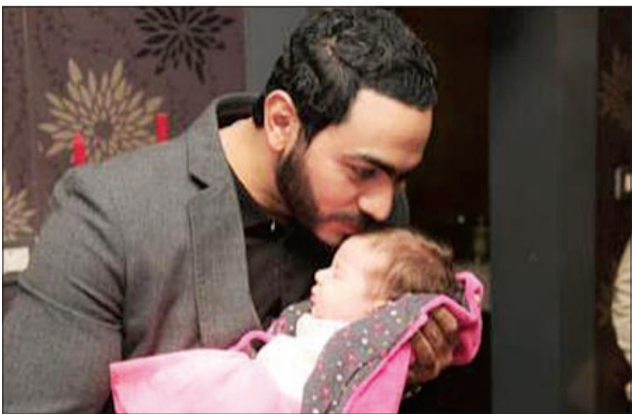
صورة لتامر حسني مع الطفلة التي قيل أنها ابنته

مفاجئ، كذلك اعتقد كثيرون أن الإنجاب سيكون بالصورة المفاجئة نفسها. والحقيقة أن الطفلة التي ظهرت مع تامر في الصورة هي ابنة صديقه وليد منصور منظم الحفلات الشهير، وقد حرص النجم المصري وزوجته على حضور الاحتفالية التي أقيمت لها في الوقت نفسه، ينتظر تامر قدوم ابنته الأولى قريبا.