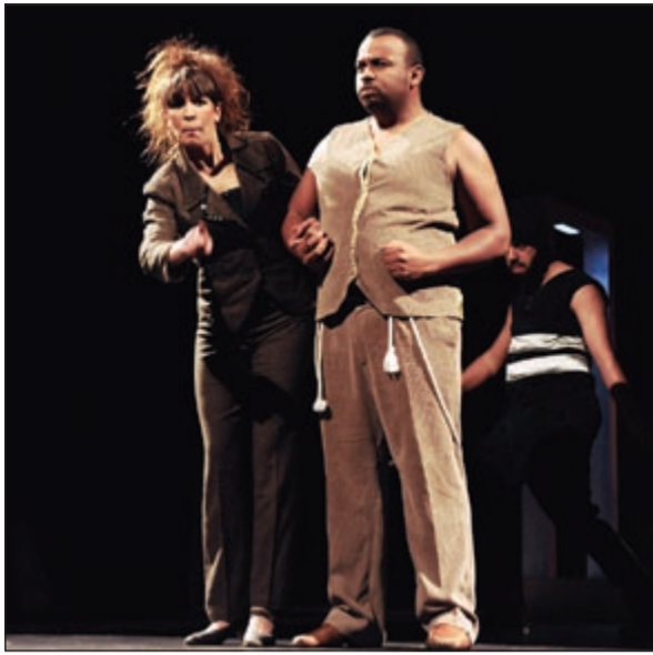
مشهد من مسرحية «تمارين على التسامح»