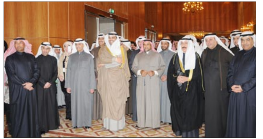
الشيخ محمد العبدالله وعدد من المشاركين في افتتاح منتدى التوظيف الثامن