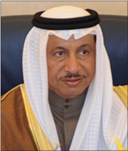
سمو رئيس مجلس الوزراء الشيخ جابر المبارك

مواطن يعمل في إحدى الهيئات التابعة لمجلس الوزراء يعاني حالة صحية آخذة في التدهور وتسبب له مع استمرار العمل خطورة على حياته ويأمل في مساعدة سمو رئيس مجلس الوزراء الشيخ جابر المبارك مساعده في الحصول على فرصة التقاعد لظروفه وضعه الوظيفي، كون راتبه الحالي لن يكفي التزامات أسرته في حال تقاعده. ويشير المواطن، الذي يعاني تشوهات خلقية اثر حادث مروري تعرض له ما تسبب له الحادث من تدهور في صحته، علاوة على التشوه، اذ ترافقه فتحة في الرأس بعد عدد من العمليات الجراحية التي اجريت له حتى انه الآن معرض للإصابة بمرض السرطان بسبب تعرضه للشمس لفترات طويلة.