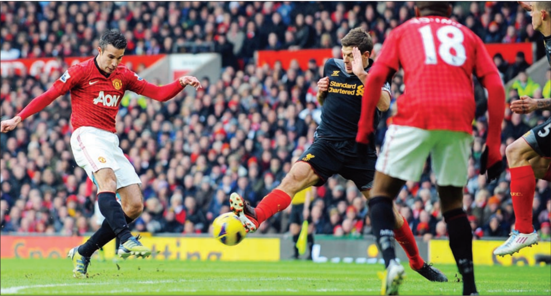
روبن فان بيرسي قاد مان يونايتد للفوز على ليفربول بتسجيله الهدف الأول وصناعة الثاني

حسم مان يونايتد المتصدر موقعه مع ضيفه وغريمه التقليدي ليفربول 2-1 أمس في المرحلة الثانية والعشرين من الدوري الإنجليزي لكرة القدم، فيما تمكن جاره اللدود مان سيتي حامل اللقب من إسقاط أرسنال في معقله للمرة الأولى منذ أكثر من 37 عاما بالفوز عليه 2-0.