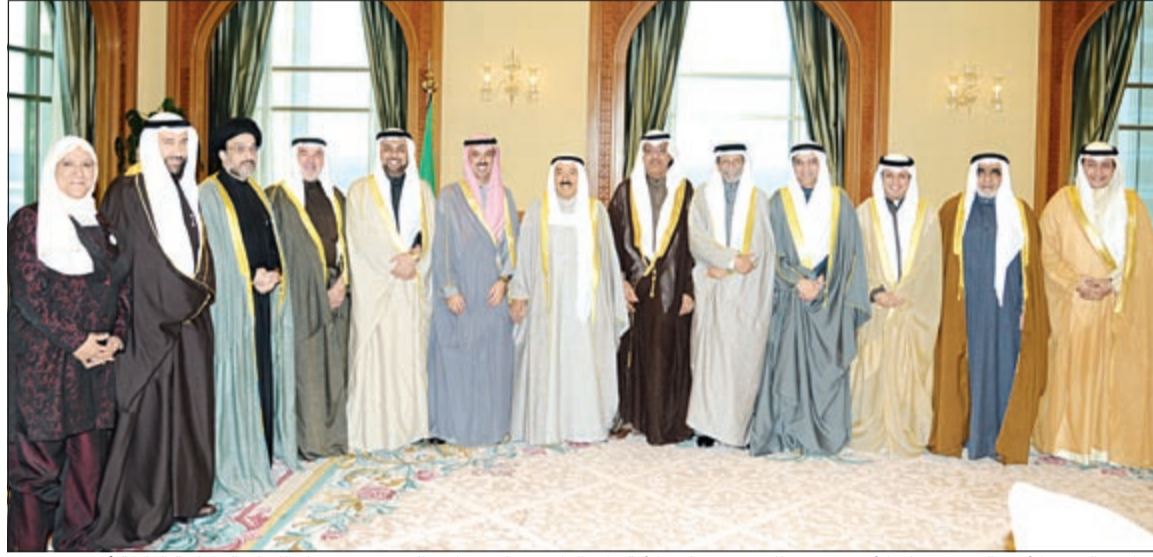
صاحب السمو الأمير الشيخ صباح الاحمد متوسلا رئيس مجلس الأمة علي الراشد ونائبه مبارك الخرينج ورؤساء اللجان البرلمانية الدائمة أمس

قالت رئيسة اللجنة التشريعية في مجلس الأمة د.معصومة المبارك لـ «الأنباء» إن من ضمن أولويات اللجنة موضوع استقلالية القضاء. وأضافت أن «صاحب السمو الأمير الشيخ صباح الاحمد تسأل «هل لا يوجد لدينا استقلالية للقضاء» فأجبت «توجد لدينا استقلالية للقضاء في الأحكام ويتمتع بالنزاهة والحيادية ولكن طبيعة العلاقة بين وزارة العدل والقضاء تحتاج قانونيا أن نضعها في إطار واضح وذلك لتحقيق النقلة النوعية الإصلاحية». وأضافت د.معصومة أنه بجانب استقلالية القضاء توجد لدينا أولويات أخرى منها إنشاء النيابة الإدارية، ومكافحة التمييز العنصري، ونقل إدارة الطب الشرعي من وزارة الداخلية إلى وزارة العدل.