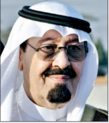
خادم الحرمين الشريفين الملك عبدالله بن عبدالعزيز

الأمير هنا خادم الحرمين بتعيين 30 امرأة في «الشورى»: يعزز دور المرأة ويضاعف عطاءها في خدمة المملكة