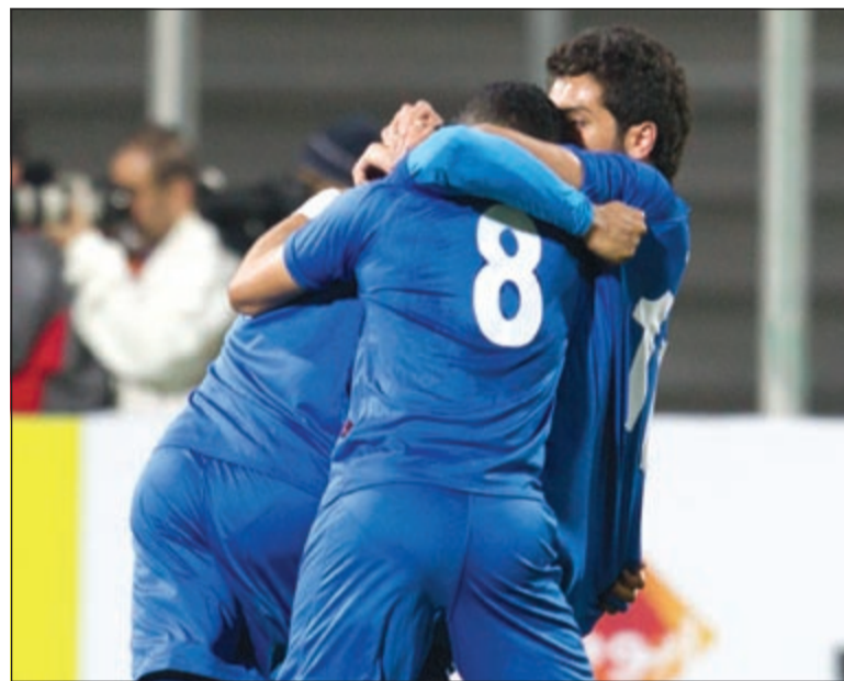
فرحة نجوم المنتخب الوطني بالفوز على السعودية وتأهلهم إلى نصف النهائي