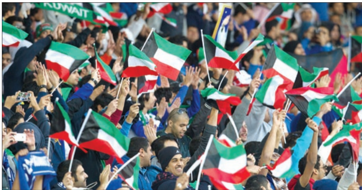
الجمهور الكويتي الغفير آزر اللاعبين بقوة وشجعهم بحرارة على التأهل لنصف نهائي «خليجي 21» (الأزرق كجم)