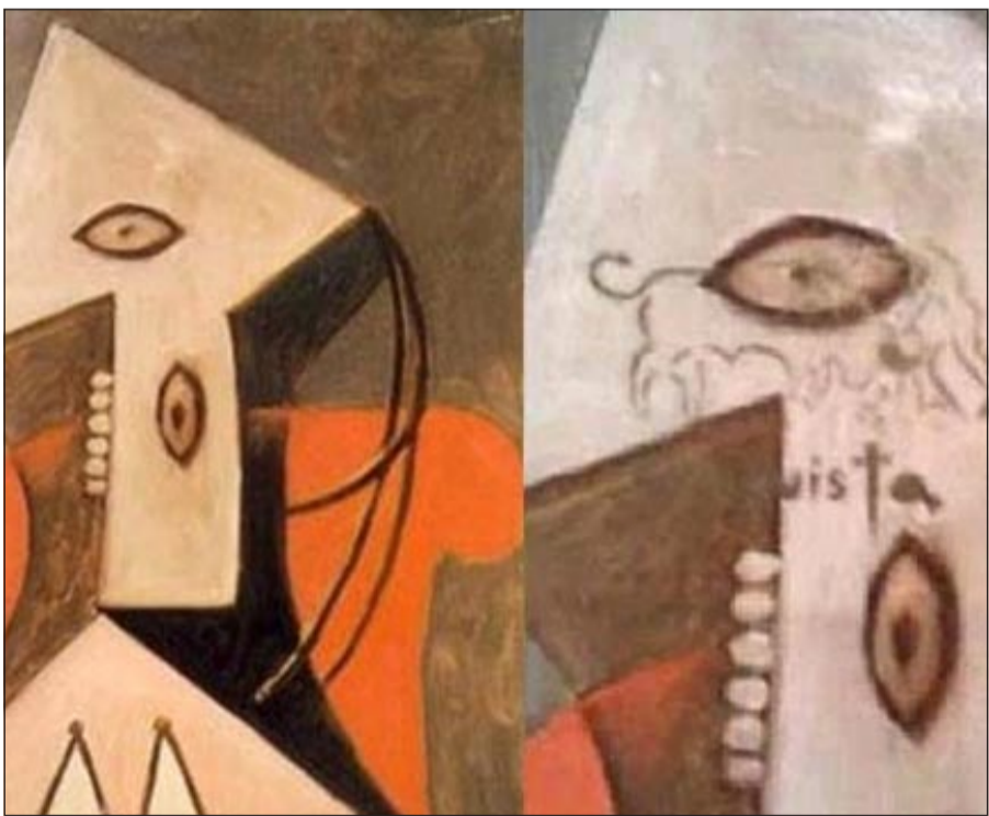
لوحة «امرأة جالسة على مقعد أحمر»

في ولاية تكساس، الرجل، الذي يرتدي بزة قائمة اللون، يتقدم باتجاه أحد أعمال الفنان من المرحلة التكعيبية، والمسمى «امرأة جالسة على مقعد أحمر»، ويدون عليه سريعاً شيئاً بواسطة رذاذ طلاء قبل أن يلوذ بالفرار. ويحدد شريط الفيديو هوية المهاجم بالاسم. ويظهر لاندربوس في شريط آخر عاري الصدر، ويقف في الظل قائلاً إنه لا ينوي «تخريب اللوحة، بل تمرير رسالة فنية وسياسية».