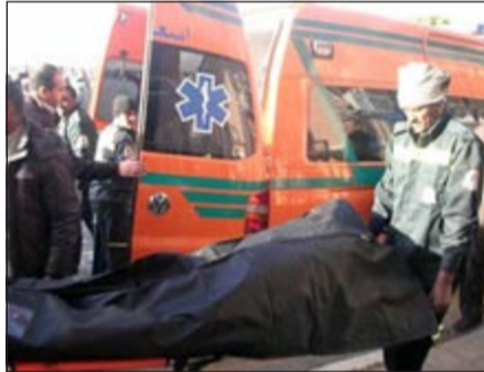
جثة إحدى الضحايا