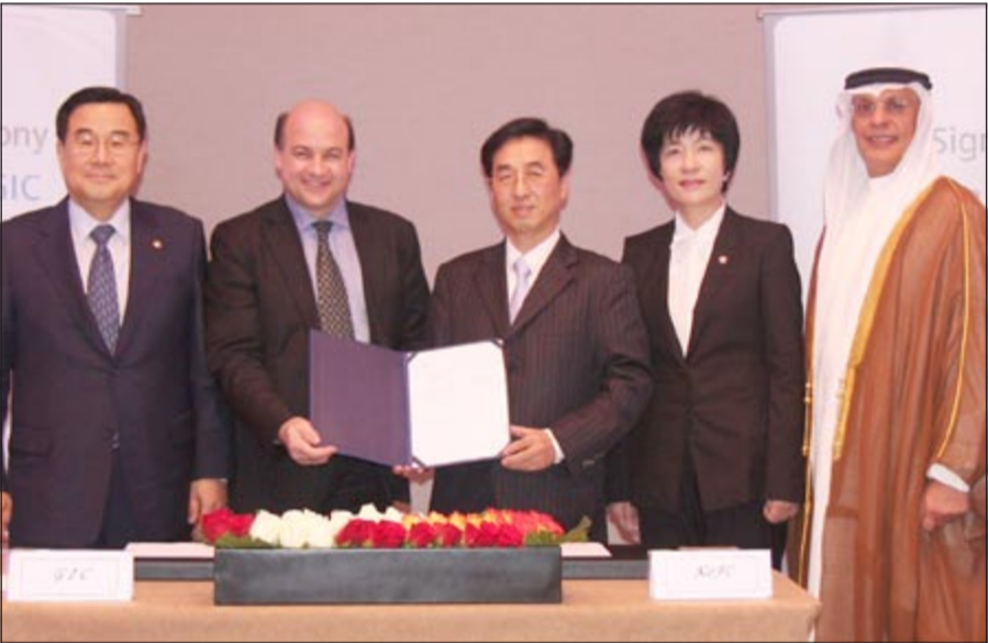
لقطة جماعية عقب التوقيع

أعلنت مؤسسة الخليج للاستثمار عن توقيعها في دبي مذكرة التفاهم مع مؤسسة كوريا للتمويل (KofC)، حيث تعكس مذكرة التفاهم اهتمام القائمين على مؤسسة كوريا للتمويل بإقامة شراكة مع مؤسسة الخليج للاستثمار لتكون شريكة الاستثماري المفضل في منطقة مجلس التعاون الخليجي، ويتوج مثل هذا الاستثمار العمل المهم الذي بدأته المجموعة الصناعية الكورية في منطقة الخليج في حقبة السبعينيات من القرن الماضي.