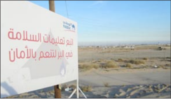
«الوطني» يبدشن حملته البيئية السنوية بلافتات توعوية