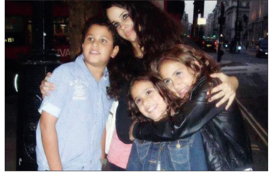
صورة تجمع أبناء عمرو دياب الأربعة

للمرة الأولى، نشر عمرو دياب صورة تجمع أبناءه الأربعة عبر موقعه الرسمي، ووصفهم بـ «العصابة». وقد تم التقاط الصورة في شوارع الولايات المتحدة الأمريكية، حيث تعيش الابنة الكبرى «نور» التي أنجبها «الهضبة» من طليقته شيرين رضا في بداية التسعينيات. وتتضمن الصورة، حسب موقع «انا زهرة»، أبناء عمرو