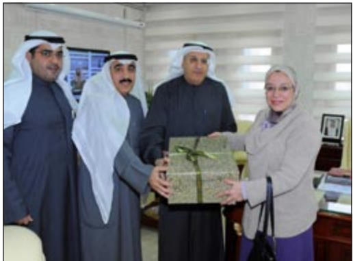
علي الرئيس خلال لقائه د.لياء محمود

بحث وكيل وزارة الإعلام بالإنابة علي الرئيس مع نائب رئيس شبكة صوت العرب د.لياء محمود تعزيز سبل التعاون بين الوزارة والشبكة من خلال تفعيل الاتفاقية الإعلامية بينهما.