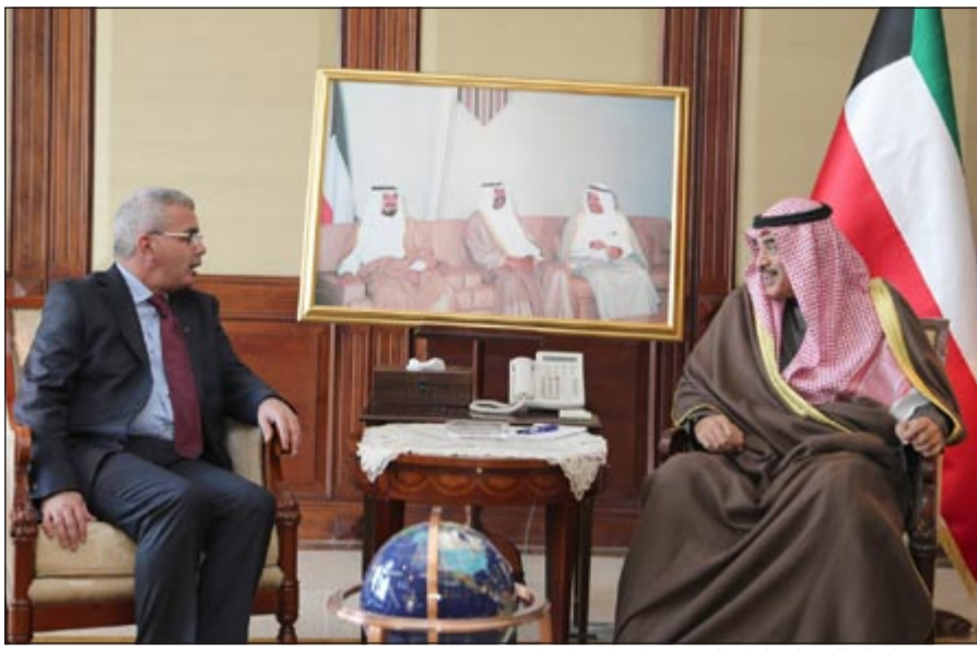
الشيخ صباح الخالد خلال لقائه السفير رامي إحسان طهوب

كما تم التوقيع على ثلاث اتفاقيات ومذكرات تفاهم بين البلدين في المشاورات السياسية بين وزارتي خارجية البلدين والأعفاء من تأشيرة الدخول لحاملي الجوازات الديبلوماسية والخاصة بالتعاون الثقافي والفني.