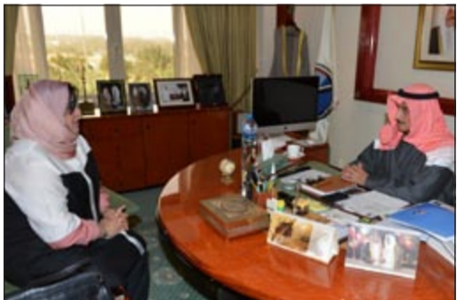
الشيخ د.ابراهيم الدعيج خلال لقائه د.مايسة الهاشمي

استقبل محافظ الأحمدى الشيخ د.ابراهيم الدعيج امس سفيرة النوايا الحسنة في منظمة الأمم المتحدة للسلام الدولي وحقوق الإنسان الإعلامية مايسة الهاشمي.