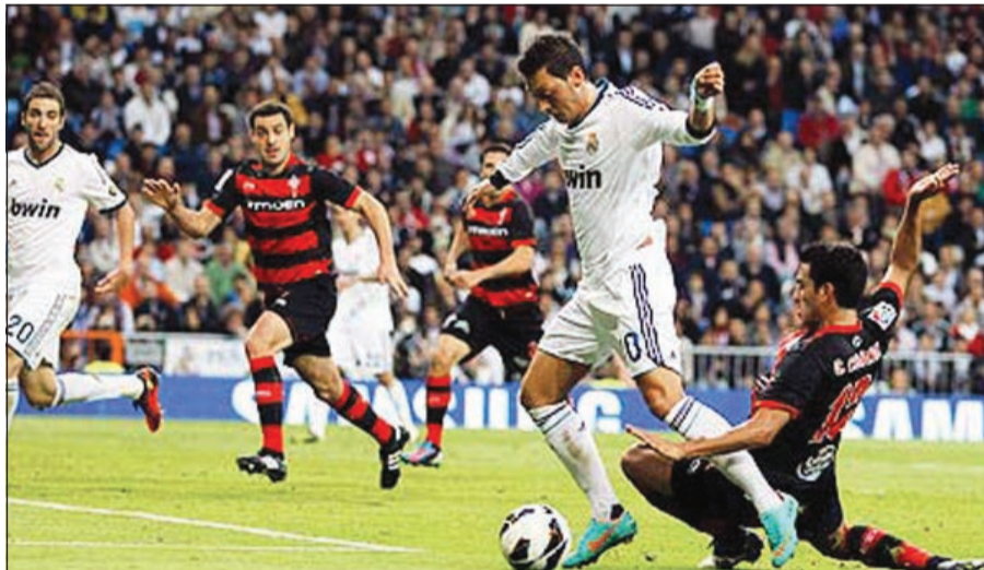
نجم ريال مدريد مسعود أوزيل شارك في مباراة الذهاب أمام سلتا فيغو

هذا الموسم إلى الإسباني بويان كركيتش الذي تمكن بعد دخوله بدلا من أنتونيو توفنتوس ليبلغ المربع الهدف الأول في الدقيقة 67 من كرة رأسية اثر عرضية من الغاني كيفن برينس بواتنغ، ثم اضافة جامباولو باتزيني الهدف الثاني في الدقيقة 80 من ركلة جزاء انتزع بنفسه بعد خطأ عليه داخل المنطقة من قبل البرازيلي فيليببي، قبل أن يقلص ميكيلي باولوتشي الفارق في الدقيقة 87 من كرة رأسية. ورفع الفريق اللومباردي رصيده إلى 30 نقطة في المركز السابع. ويستكمل الدور ربع النهائي الثلاثاء 15 الجاري بمباراة انتر ميلان مع بولونيا والأربعاء 16 منه بمباراة فيورنتينا مع روما، ويقام في دور نصف النهائي ذهاب الدور في 23 الجاري والإياب في 30 منه، والمباراة النهائية في مايو المقبل على الملعب