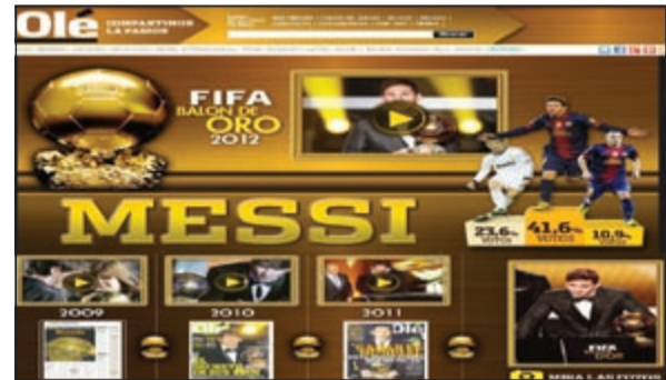
صحيفة «أوليه» الأرجنتينية تغزل في ميسي