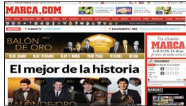
غلاف صحيفة «ماركا» المدريدية تشيد بميسي العظيم

بيكيه (برشلونة) والإسباني سيرخو راموس والبرازيلي مارسيلو (ريال مدريد)، ولاعبو الوسط الأسباني تشافي هرنانديز وانيستا (برشلونة) والإسباني تشابي ألونسو (ريال مدريد)، والمهاجمون ميسي (برشلونة) والكولومبي راداميل فالكاو (اتلتيكو مدريد) ورونالدو (ريال مدريد). كما نال مدرب المنتخب الإسباني فيسنتي دل بوسكي جائزة أفضل مدرب خلفا لمواطنه جوسيب غوارديولا بعد أن قاد