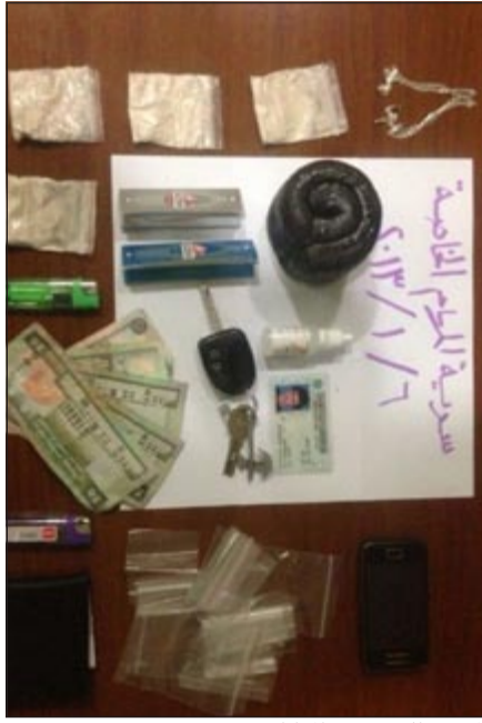
المضبوطات بحوزة المواطن

اسقط رجال سرية المهام الخاصة مواطنًا في منطقة السالمية وبحوزته كمية من المواد المخدرة التي احيل على اثرها الى الادارة العامة لمكافحة المخدرات وتم رفع تقرير بالواقعة. وقال مصدر امني ان دورية تابعة لسرية المهام الخاصة اشتبه رجلها في مركبة كان قائدها يحاول الهروب من رجال الامن دون ان ينتبهوا له، الا انهم احسوا به، فطلبوا منه التوقف، ولم يمتثل لاوامرهم، وعليه تم طلب الاستناد وتضييق الخناق عليه وايقافه وعثر بحوزته على قطع من الحشيش والهيروين وادوات التعاطي ليتم احالته الى جهة الاختصاص وسجلت قضية.