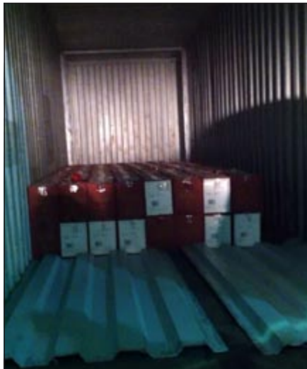
الخمور المستوردة التي تم ضبطها في الميناء

أحبط رجال جمارك الشيوخ ادخال كمية من الخمور المستوردة وهي عبارة عن 300 كرتون وضعت داخل احدى الحاويات 40 قدما التي تم التحفظ عليها واحالتها الى النيابة.