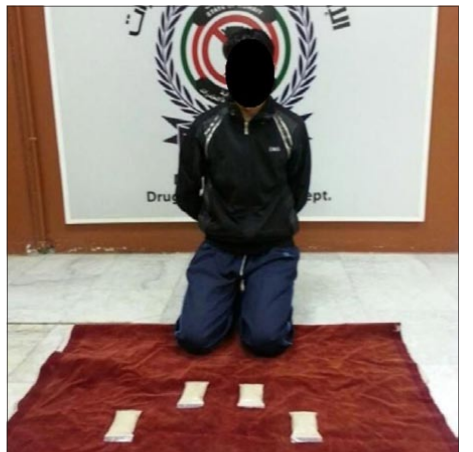
الآسيوي وامامه كمية المضبوطات

تواصل الإدارة العامة لمكافحة المخدرات جهودها للتصدي لمروجي هذه الآفة. وقد تمكنت ادارة مكافحة المحلية التابعة للإدارة العامة لمكافحة المخدرات من ضبط آسيوي بحوزته هيروين، وذلك بعد ورود معلومات تفيد بجيازته للمواد المخدرة بقصد الاتجار، وبناء على تلك المعلومات تم تكثيف