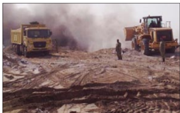
جانب من جهود إخماد الحريق

وقد قامت جرافات البلدية بدفن الإطارات أثناء اندفاع الحريق من خلال رفع الرمال بآليات البلدية ودمها على تلك الإطارات وذلك بالتعاون مع الإدارات العامة للإطفاء والحرس الوطني التي شاركت البلدية بإخماد الحريق وتعاملت بروح الفريق الواحد في مثل هذه الظروف الطارئة. من جهتها، أكدت إدارة