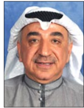
د.عبد الحميد دشتي

أكد النائب د.عبد الحميد دشتي انه لا توجد اي نية لدى الحكومة او النواب لاجراء اي تعديل على الدستور راهناً، معتبراً ان ما يتم ترديده بهذا الخصوص نسج من خيال ورمي لبالونيات وفضاعات لقياس ردود الفعل. وقال دشتي، في تصريح للصحافيين: نحن لسنا بحاجة للمساس بأي مادة دستورية، ولدينا رؤى، وسمعنا الخطاب