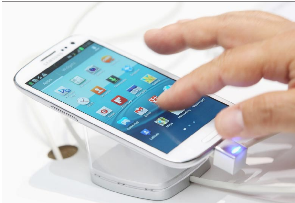
جالاكسي إس 4 الجديد

عليه في جالاكسي إس 3. وحسب التسريبات الحالية لمواصفات الجهاز فإنه سيعتمد على معالج رباعي النواة وذاكرة بسعة 2 غيغابايت وشاشة بقياس 4.99 بوصات بدقة 1800x1920 بيكسل وكاميرا بدقة 4.2، 1 ميغابيكسل والإصدار 4.2.1 من نظام أندرويد.