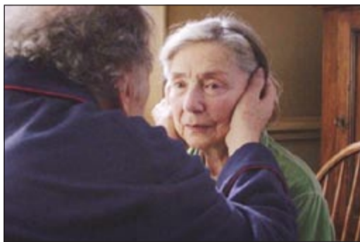
مشهد من فيلم «الحب»

نيويورك - د.ب.أ: اختارت الجمعية الوطنية لنقاد السينما في الولايات المتحدة فيلم «الحب» كأفضل فيلم في عام 2012 وذلك أثناء اجتماعها السنوي في نيويورك. وحصل المخرج النمساوي مايكل هانتيكه على لقب أفضل مخرج عن فيلمه الفرنسي - الألماني - النمساوي المشترك «الحب»، الذي يتناول آثار الشيخوخة والخرف على زوجين مسنين، وكان الفيلم حصل من قبل على الجائزة الكبرى لمهرجان كان السينمائي.