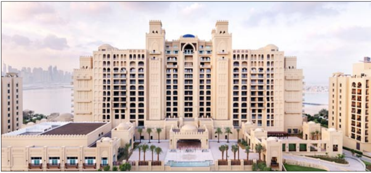
فندق «فيرمونت النخلة»

هذا، ويعد فندق فيرمونت النخلة المرحلة الثانية من مشروع ضخم بلغت تكلفته 616 مليون دولار، حيث ضمت المرحلة الأولى من المشروع 562 منزلاً فاخراً، وبهذا يكون إجمالي عدد الوحدات في المرحلتين الأولى والثانية 957 وحدة، وبمكتمل موقع الفندق المتميز، وواجهته الواضحة، سيستفيد الفندق من قربه لمواقع أخرى مثل مدينة دبي للأعلام، ومدينة دبي للإنترنت وجزيرة النخلة ككل. ويتألف فندق فيرمونت النخلة، إضافة إلى المقاهي والمطاعم، من 10 طوابق من الغرف والإجنحة الفاخرة، صممت بأسلوب فريد وباب دخول واحد للغرف الخنائية المشتركة متيحاً بذلك لزواره من الأسر فرصة التمتع بالمساحات المشتركة، ويتوافر في كل غرفة أحدث أنظمة الترفيه والاتصالات، بما في ذلك إنترنت عالي السرعة، وشاشة تلفزيون LED قياس 40 بوصة، وحوض استحمام وكابينة دش منفصلة. الجدير بالذكر أن فندق «فيرمونت النخلة» هو ثالث فندق يحمل علامة «فيرمونت» في محفظة إيفا للاستثمارات الفندقية.