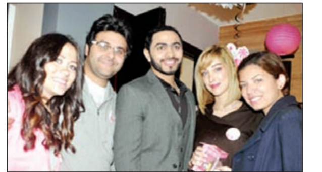
تامر وزوجته بسمة في عقيقة بنت وليد منصور

وحرمة دينا راشد الاحتفال بعقيقة كريمتهما «خديجة» التي أقامها داخل قبليتهما بالرحاب وكان ضمن الحضور تامر حسني وحرمة المطربة المغربية المعتزلة بسمة بوسيل، خالد سليم وحرمة خيرية هشام، شذى، رامي صبري وحرمة، مي سليم وابنتها، مروة نصر وزوجها المنتج محمد علام، حمادة هلال، كريم محسن، حمدي بدر وحرمة.. وغيرهم. وخلال الحفل تلقى النجم تامر حسني العديد من التهاني لانتظاره حادناً سعيداً خلال الأيام القادمة.