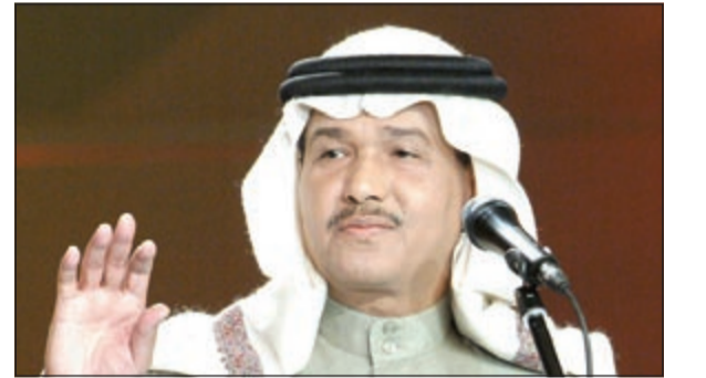
فنان العرب محمد عبده

قطري أهداها طائرة خاصة كمهر، وخصاً من الالماس الحر بقيمة 450 ألف ريال سعودي، كشبكة العرس. ووفقاً لصحيفة «اليوم»، أكدت مريم أنها للمرة الأولى تصرح بهذا الأمر، قائلة: إن فنان العرب سبق أن طلب الزواج مني، وأرسل لي رسائل على جوالي يعبر فيها عن حبه لي، وكذلك رغبته في الزواج مني، إلا أنني رفضته رغم إصراره على ذلك، وأضافت: أعشق الفنان الكبير محمد عبده منذ سنوات، وأنا من أشد المعجبين بفنّه وأدائه الفني، لكنني فضلت أن أحفظ بهذا الإعجاب الفني ولا أفسده بالزواج، خاصة أنه فنان كبير لا يختلف أثنان على أنه هامة فنية كبيرة، ليس في المملكة العربية السعودية فحسب، وإنما في الوطن العربي أجمع، مشيرة إلى أنها ما زالت تحتفظ برسائل محمد عبده على جوالها حتى الآن. كما قالت مريم أيضاً: إنها ليست نادمة على رفض محمد عبده كزوج لها، موضحة أن تقديرها من محمد عبده ومكانته في الوسط يغنيها عن هذا الرفض، مؤكدة في الوقت نفسه أنها وافقت على خطبة ملياردير قطري لها.