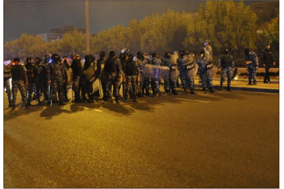
أفراد القوات الخاصة أثناء جهوزيتهم لمواجهة المتجمعين