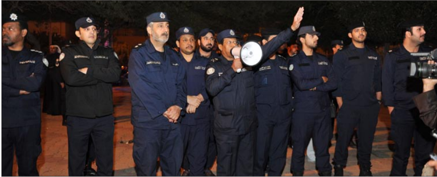
القيادات الامنية تخاطب «مسيرة كرامة وطن 5» بضرورة فض التجمع لعدم وجود ترخيص رسمي

كما كان متوقعا، قام منظمو مسيرة «كرامة وطن 5» بتغيير نقطة التجمع ثم الانطلاق للمسيرة من الاماكن المعلن عنها سابقا الى موقع جديد هو مواقف المعهد الديني في منطقة قرطبة في الجهة المقابلة لمنطقة السرة على امتداد شارع دمشق. وأمس، اعلن المنظمون من حسابهم على تويتر ان هناك 3 نقاط تجمع هي: نقطة التجمع الاولى في مواقف النادي العربي، ثم نقطة التجمع