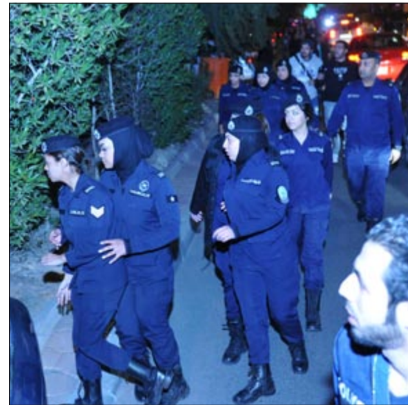
الشرطة النسائية تواجدت في موقع الحدث