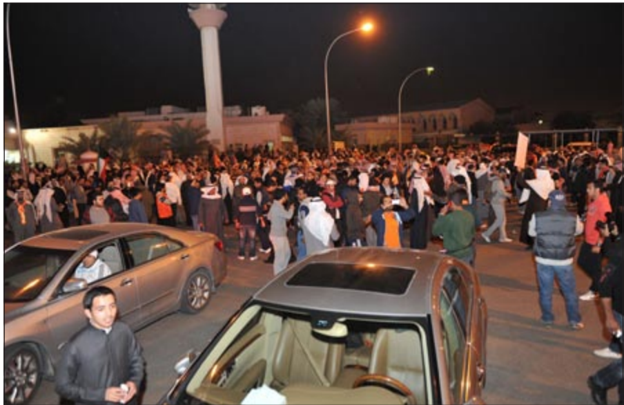
المشاركون في التجمع في مواقف المعهد الديني