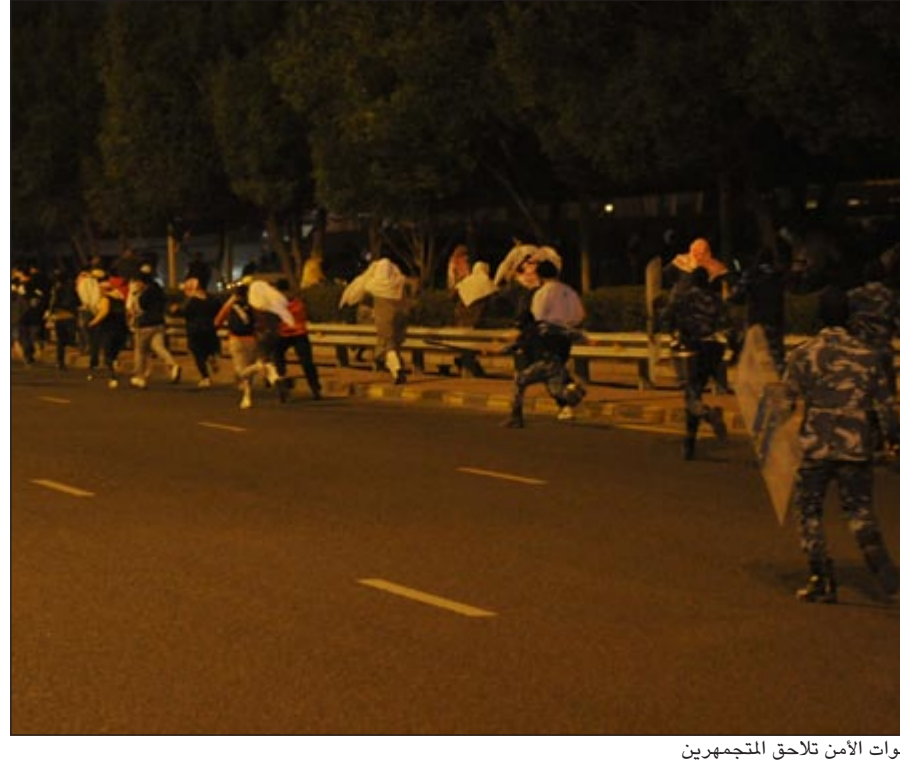
قوات الامن تلاحق المتجمعين