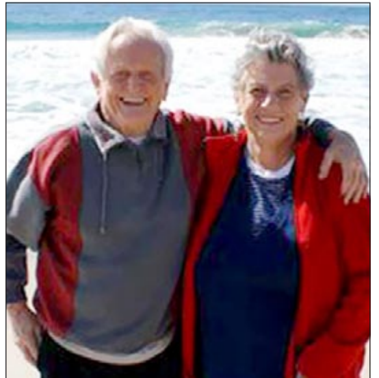
والد ميل غيبسون وطليقته

يشار إلى ان غيبسون وهيكس تزوجا في العام 2001 وانفصلا في مايو الماضي وتقدم الزوج يطلب الطلاق في يونيو. وكان النجم الهوليوودي ميل غيبسون اتهم زوجته والده بأنها لا تعطيه الأدوية في الوقت المناسب حتى تعجل بوفاته.