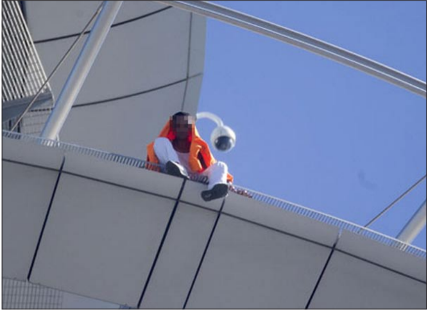
الرجل على حافة أعلى مبنى في نيوزيلندا

نيوزيلندا - د.ب.أ: توقف المرور لأكثر من خمس ساعات في أكبر مدينة بنيوزيلندا امسس فيما كانت الشرطة تتفاوض مع رجل هدد بالقفز من الطابق الـ 54 لأعلى مبنى في البلاد. وقالت وسائل اعلام محلية ان الرجل الذي ربما كان يشارك في رياضة للقفز قام بلكه أحزمة الأمان وجلس على حافة منصة وبدأت عليه حالة من الهلع بينما كان شهود العيان يراقبونه في حالة من الرعب. وتمكن محققو الشرطة وأحد القساوسة من اقناع الرجل بالنزول من المبنى. وهلت الحشود في الشوارع أسفل مبنى «سكاي تاور» في أوكلاند بينما جرت تسوية المسألة وأعيد فتح الطرق.