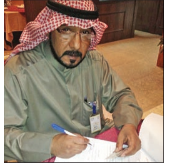
تحرير مخالفة بحق أحد المحلات