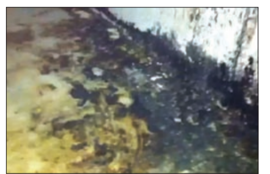
عدم التقيد بقواعد النظافة العامة