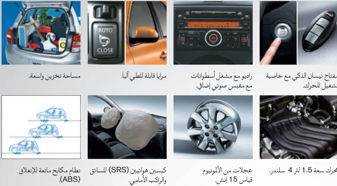
مساحة تخزين واسعة.