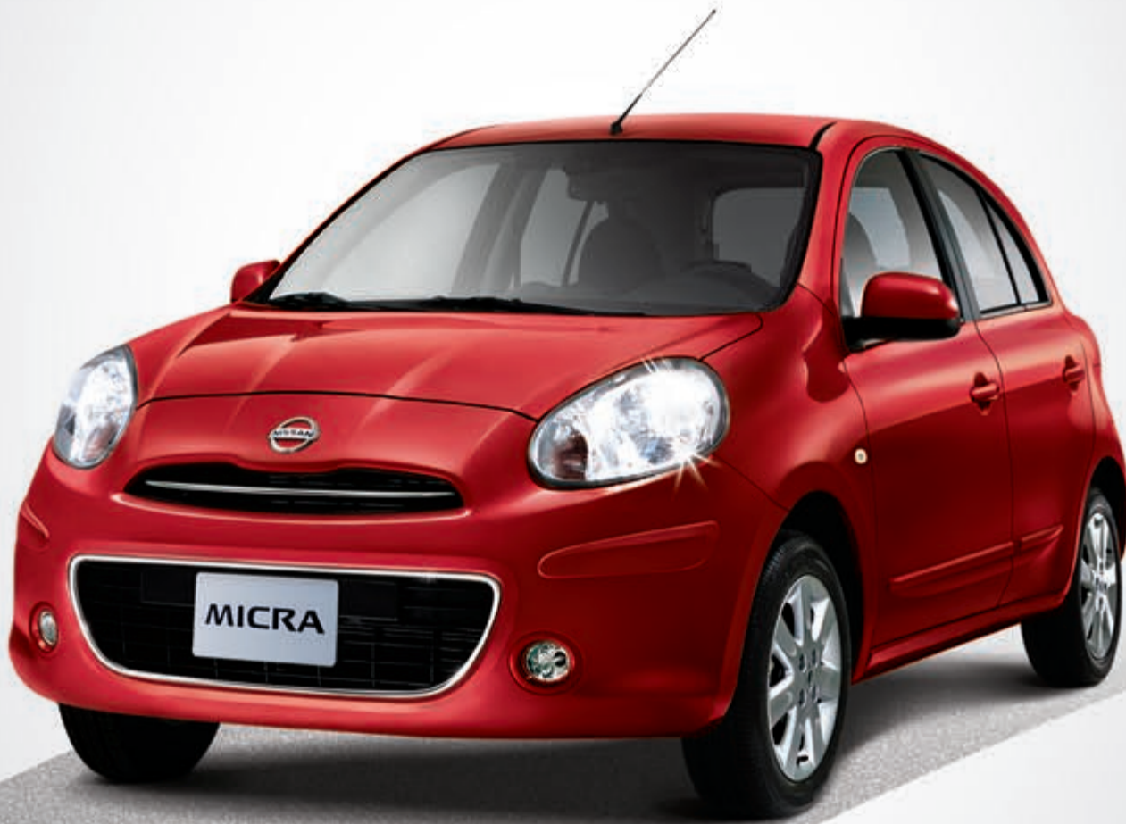
محرك سعة 1.5 لتر 4 سلندر.