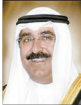
الشيخ مشعل الاحمد

فيها آراء المتقدمين للالتحاق بالحرس الوطني حول آلية القبول وما تتضمنه من