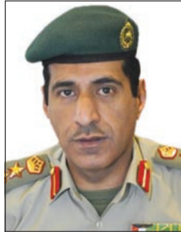
العميد الركن فهد عيد ناصر

أعلنت الرئاسة العامة للحرس الوطني تمديد التسجيل لقبول طلبات دفعة جديدة من المتقدمين، وطلبات الإعادة الى الخدمة من ضباط الصف والافراد، حيث يستمر تلقي الطلبات الذي بدأ في 23 ديسمبر الماضي حتى 10 الجاري بدلاً من 3 منه نظراً لاقبال الكبير وتزايد اعداد المتقدمين. وكان نائب رئيس الحرس الوطني الشيخ مشعل الاحمد قد قام بزيارة مفاجئة الى مكتب التسجيل استطلع