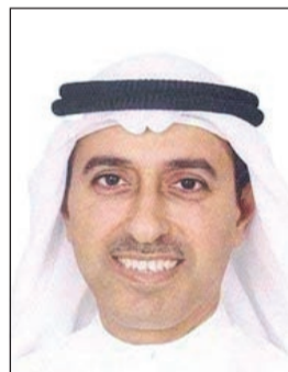
المستشار عادل العيسى

والتي تنص على اعتبار معهد الكويت للدراسات القضائية والقانونية مركزاً إقليمياً لتدريب القضاة وأعضاء النيابة العامة العرب في مجال القانون الدولي الإنساني على الصعيدين الوطني والإقليمي وكذلك لتوثيق أحكام القانون الدولي الإنساني والاتفاقيات الدولية. وأوضح المستشار العيسى أن لفيقا من خبراء اللجنة الدولية للصليب الأحمر المتخصصين في القانون الدولي