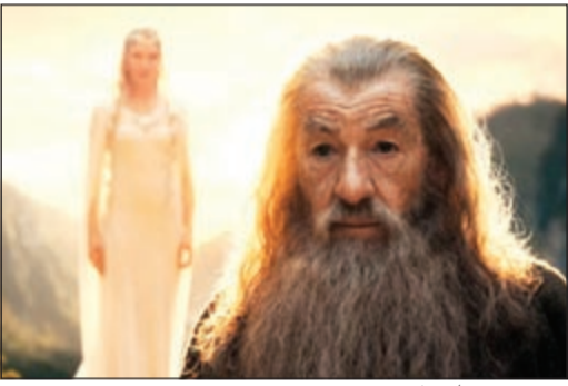
مشهد من فيلم «ذي هوبيت»

لوس أنجيليس - أ.ف.ب: حافظ الجزء الأول من سلسلة أفلام «ذي هوبيت» المعنون «ذي هوبيت: إن أنكسبكتد جورني» على مركز الصدارة في شباك التذاكر في أميركا الشمالية خلال عطلة نهاية الأسبوع الأخير من العام، على ما أعلنت شركة «إكزيبيتر ريلانسنز».