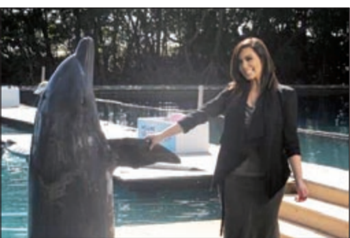
الدلفين يصافح كيم كارديشيان

ضمن جولة لها في ميامي قصدت أسرة كارديشيان زيارة أحد الأحواض المائية التي يعيش فيها سمك «الدلفين».