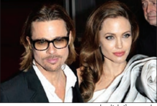
براد بيت مع أنجلينا جولي

باريس - أ.ش.؛ هل تزوج الممثل براد بيت أم أولاده السنة الممثلة الجميلة أنجلينا جولي في دفة شمس بحر الكاريبي في عيد الميلاد؟.. هذا ما لم تستعبده مجلة «كلوزير» الفرنسية التي نشرت معلومات غير مؤكدة مفادها بأن بيت وجولي تزوجا في سرية تامة في جزيرة «تورك أت كايبك» الساحرة.