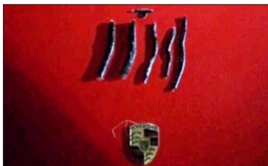
المخدرات المضبوطة في البورش