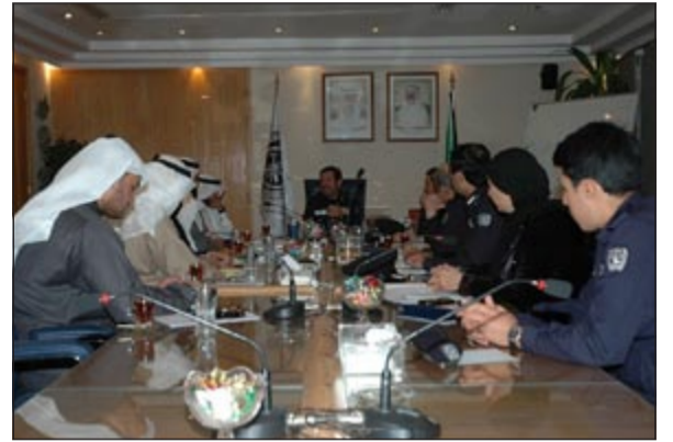
اللواء يوسف الأنصاري مترسا الاجتماع