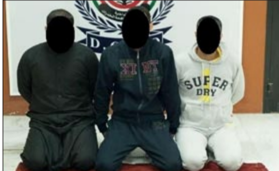
المتهمون وامامهم المضبوطات

الأول والسذي تواجد معه المتهم الثاني والعمور على ما يقرب كيلو ونصف الكيلو من مادة الحشيش المخدرة وكمية من المؤثرات العقلية وسجائر محشوة بالحشيش ومعدة ومهياة للبيع. كما اعترف المتهم الأول بأنه يحصل على المخدرات من المتهم الثالث مرشدا عن مسكنه، ويتفتشه عثر على ما يقارب الكيلو من مادة الحشيش المخدرة وكمية من المؤثرات العقلية، معترفا بأنه مصدر هذه المخدرات، وتمت احالة المتهمين والمخدرات الى