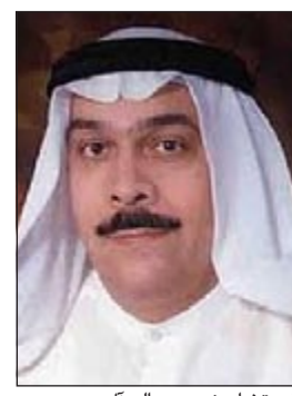
المستشار نصر سالم آل هيد

ألغت محكمة الاستئناف برئاسة المستشار نصر سالم آل هيد وعضوية المستشارين سرور برغل ومحمد شتا حكم محكمة الجنايات ببراءة خليجي من الاتجار بالمخدرات وقضت محمدا بسجنه 15 سنة وتغريمه 390 ألف دينار. وكانت النيابة قد وجهت للمتهم تهمة الاتجار بـ 52 كيلوغراما من الحشيش