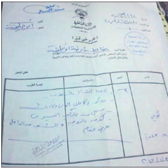
التقرير الطبي الخاص بالطلاب