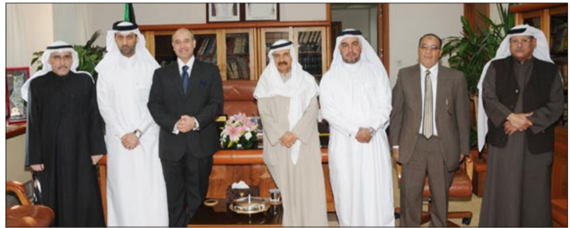
المستشار فيصل المرشد خلال لقائه الوفد الزائر

التقى رئيس المجلس الاعلى للقضاء رئيس محكمة التمييز المستشار فيصل المرشد الوفد القضائي القطري الذي يزور البلاد حالياً في اطار جولة للوفد للاطلاع على المحاكم في الكويت للتعرف على الجهود المبذولة لإنشاء محاكم الأسرة والتي أصبحت ضرورة ملحة وحضارية لمواكبة الأنظمة القضائية الحديثة والالتقاء بالمجلس الاعلى للقضاء في الكويت للوقوف على نظام المحاكم وبخاصة الوقوف على مشروع انشاء محاكم الاسرة بشكل خاص. وقد ناقش المستشار المرشد مع الوفد القضائي القطري الخطوات التي تم اتخاذها ورؤية المجلس في هذا الصدد والاضاع والاجراءات الخاصة بمسائل مشروع قانون محاكم الاسرة لما