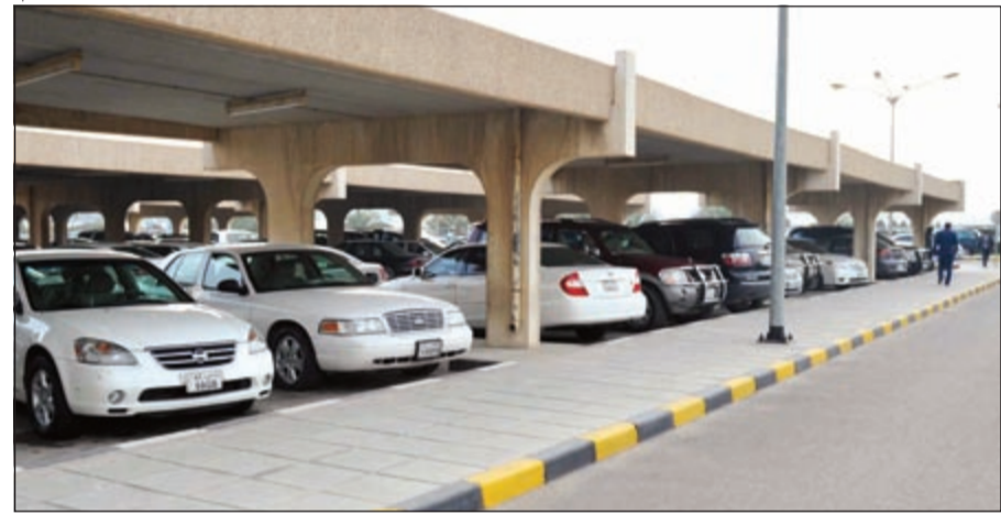
مواقف السيارات شبه ممتلئة

وزارة الصحة التي اقرار هذا الامر واعتماده، مناشدين وزير الصحة ذلك.