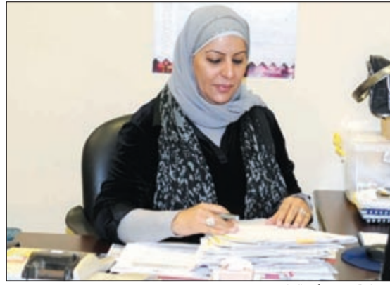
موظفة تنجز أعمالها

كوالالمبور - كونا: دعا وزير الزراعة الإندونيسي سوس وونو المستثمرين الكويتيين إلى الاستثمار في بلاده «المنفتحة على جميع المجالات الاستثمارية ولاسيما في مجال الزراعة». وجاء كلام الوزير الإندونيسي خلال لقائه سفيرنا لدى اندونيسيا ناصر العنزي للتحياح في تعزيز العلاقات الثنائية. وقال السفير العنزي في تصريح هاتفي لـ«كونا» ان اللقاء تناول العلاقات الثنائية بين البلدين الصديقين وسبل تعزيزها وتطويرها في المجالات المختلفة لاسيما في مجال الزراعة. وذكر أن الوزير الإندونيسي قام باطلاعه على الفرص الاستثمارية الزراعية الموجودة في بلاده، متمنيا على المستثمرين الكويتيين التوجه إلى هذا البلد الواعد والمنفتح للاستثمار في كل المجالات.