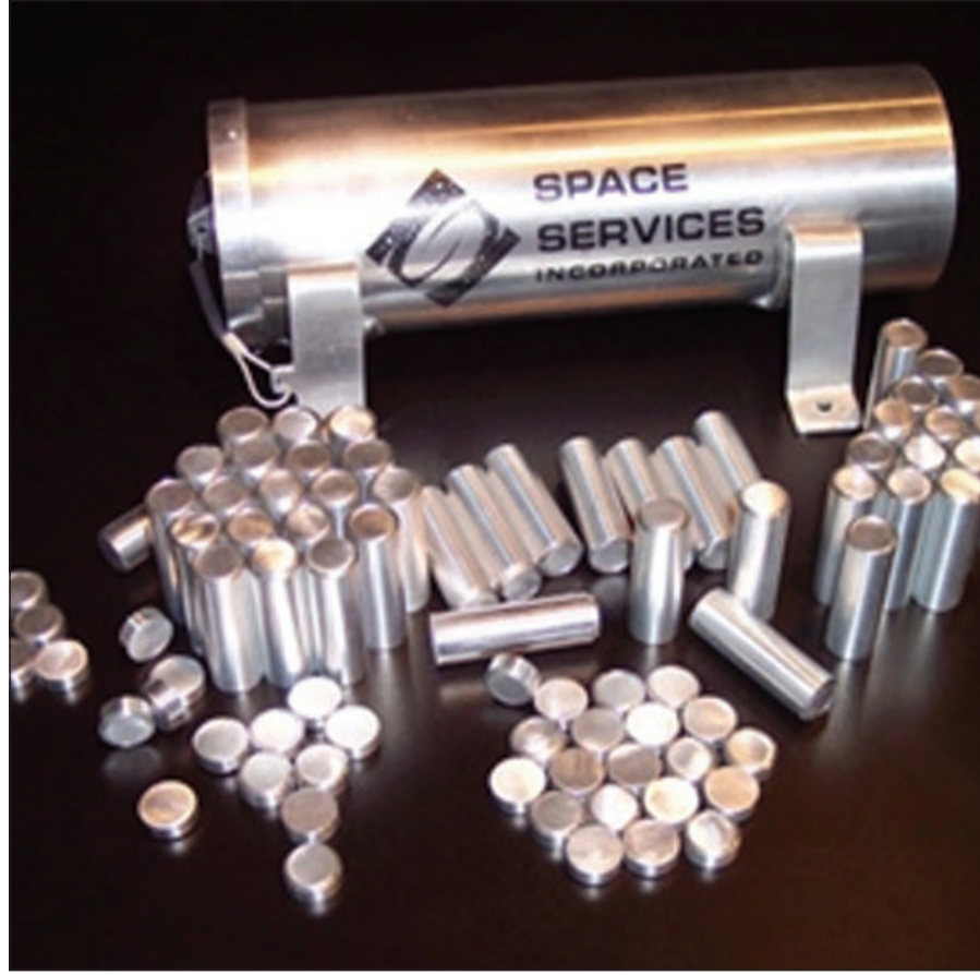
كبسولات تحوي رماد جثامين موتى بهدف اطلاقها إلى الفضاء الخارجي

غرام واحد يكلف نقله 25 ألف يورو الدفن في الفضاء آخر صيحات دفن رماد الجثامين