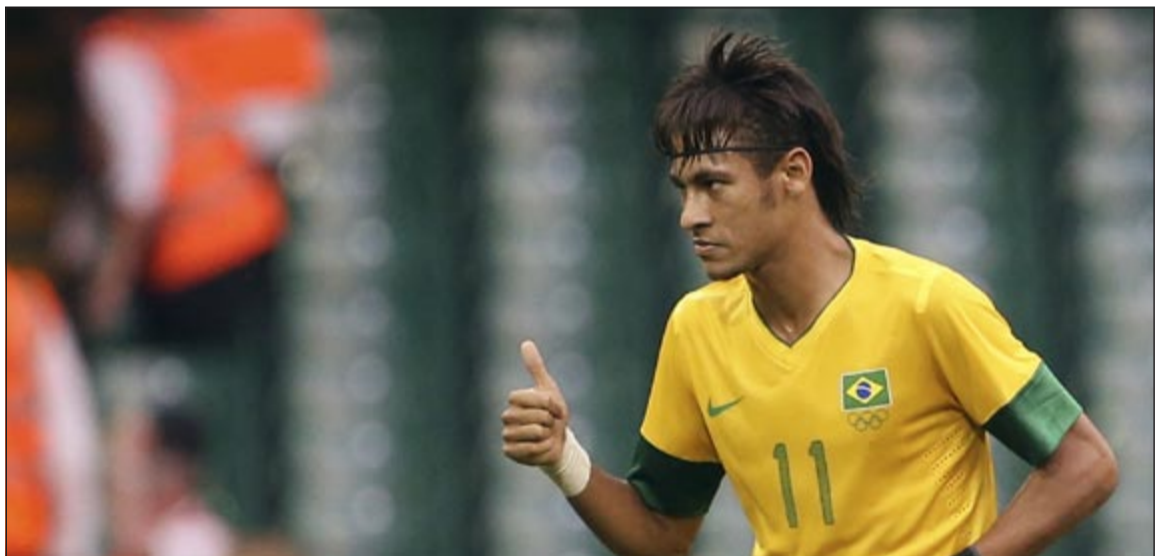
البرازيلي نيمار يفوز بجائزة أفضل لاعب في أميركا الجنوبية

ريكارو وجاريكا مدرب فيلينز ساسكيلد ومواطنه خورخي سانباولي المدير الفني الجديد لمنتخب تشيلي وأوسكار تاباريز المدير الفني لمنتخب أوروغواي في المراكز التالية. وأسفر الاستفتاء أيضاً عن اختيار التشكيلة المثالية لمنتخب أميركا والتي ضمت كلا من حارس المرمى كاسيو راموس (كورينثيانز) واللاعبين ماتياس روريجين