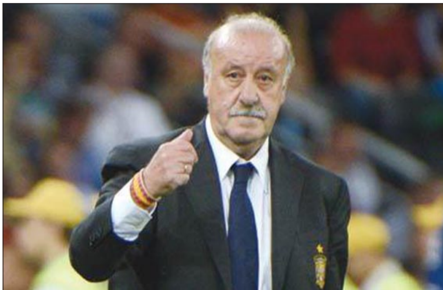
مدرب «الماتادور» الإسباني دل بوسكي

التاهل لكأس العالم بالبرازيل. سنخوض مباراتين حاسمتين في مارس المقبل أمام منتخب فنلندا وفرنسا. الفوز على فنلندا سيمنحنا الطمأنينة والهدوء الذي يساعدنا عندما نحل ضيقاً على المنتخب الفرنسي في باريس حيث تكون مباراة حاسمة على التأهل». وخلال عام 2013، يستطيع المنتخب الإسباني متصدر التصنيف العالمي منذ نحو 5 سنوات أن يختبر قدراته على المستوى الرسمي أمام منتخبات عملاقة من خلال مشاركته في بطولة كأس القارات 2013 بالبرازيل وهي البطولة الوحيدة التي لم يحزن الماتادور الإسباني لقبها حتى الآن. وقال دل بوسكي «كأس القارات بطولة مثيرة. كأس القارات 2009 خدمت المنتخب الإسباني كثيراً وساعدته على الفوز بكأس العالم 2010». الهزيمة أمام المنتخب الأميركي في المربع الذهبي لكأس القارات 2009 كانت درساً ساعدت على الاستيقاظ قبل كأس العالم 2010». وأوضح دل بوسكي أنه مازال في مرحلة البحث عن مزيد من البدائل لتدعيم صفوف الفريق وأنه يراقب لاعبين مثل ياجو أسباس وميتشو وتياجو الكانتارا رغم تأكيده على أن طموح المجموعة المتألقة معه حالياً هي مفتاح الفريق نحو تحقيق مزيد من النجاح.