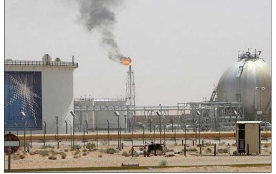
مشاتل نفط وغاز سعودية

الرياض - كونا: أعلن وزير البترول والثروة المعدنية السعودي علي النعيمي أول من أمس عن اكتشاف ثروات بترولية وغازية ومعدنية في منطقة تبوك. وقال الوزير النعيمي للمصاحفين لدى تفقده الأعمال البترولية والغازية والمعدنية القائمة بالمنطقة التي تقوم بها وزارته وشركة «أرامكو» السعودية «أن ملامح الاكتشافات التي وجدت بالمنطقة سيتم تطويرها لدعم الاستهلاك المحلي لاسيما من الغاز». وكشف عن أن تطوير حقل «مدين» الذي تم اكتشافه بمنطقة تبوك سيبدأ في العام المقبل بهدف أمداد محطات الكهرباء بالغاز الطبيعي الذي سيكون بديلا عن الديزل « ولكي تصل الطاقة