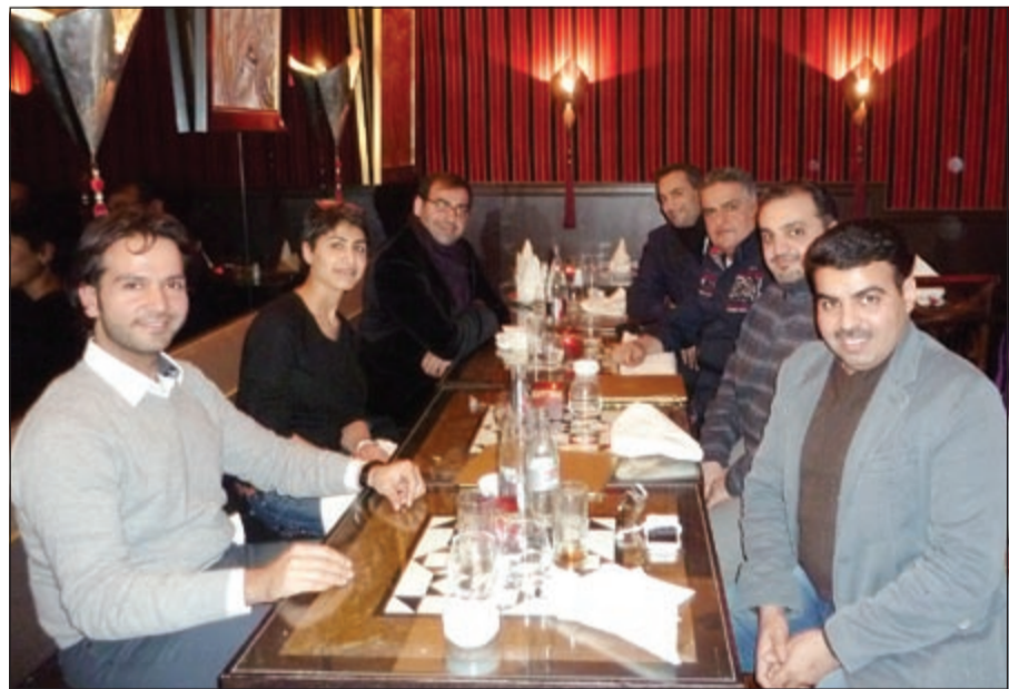
جانب من الملتقى

تحقيق الغاية السامية من هذه المتطلبات التي لها اثر ايجابي لخبرات الاطباء في المستقبل وما يعكس التطور العلمي والثقافي للمجتمع. وأكد انه تمت مناقشة تمديد سنوات الدراسة الطبية لتكملة التخصص الدقيق بعد التخرج كسنوات الزمالة الطبية، تكريم الاطباء المتخرجين من فرنسا من قبل الجهات الحكومية الكويتية المسؤولة. وأشار الى انه تمت المطالبة بتمديد سنة رئيس العيادات الطبية للأطباء (الشفيد دو كلينيك) التي سنتين دراسيتين أسوة بالطالب الفرنسي في نظام البورد الخاص للتخصص الطبي التابع لهم، لما في هذه السنتين من فائدة مهمة وضرورية للأطباء المتخصصين في نيل الوقت الكافي واللازم لاتقان تخصصهم الجراحي وممارسة مسؤوليتهم الطبية والعملية في اتخاذ القرارات الصحية في مجال عملهم الطبي.