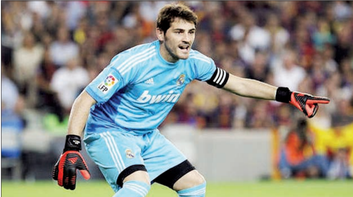
حارس عرين «الملكى» إيكر كاسياس

الثالث في جدول الدوري بفارق 16 نقطة عن غريمه برشلونة المتصدر، واحتل المركز الثاني في مجموعته بدوري أبطال أوروبا، الذي وضعه في موقف صعب بعد أن أوقعت قرعة دور الستة عشر في مواجهة العملاق الإنجليزي مان يونايتد. وجاءت العودة إلى التدريبات لتمثل بداية الاستعداد لمواجهة ريال سوسبيداد في السادس من يناير، ثم مباراة إياب دور الستة عشر لبطولة كأس