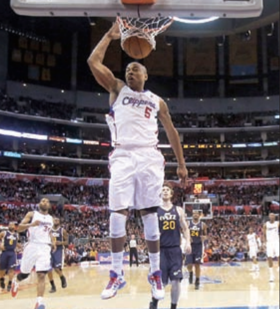
«ذلك» من كارون باتلر لاعب كليبرز في سلة يوتا جاز

حقق لوس انجيليس كليبرز مفاجأة الموسم بفوزه السابع عشر على التوالي، على حساب ضيفه يوتا جاز 107-96 في دوري كرة السلة الأمريكي للمحترفين. على ملعب «ستيلز سنتر» وأمام 19111 متفرجاً، تالق كارون باتلر (29 نقطة) لدى الفائز، إذ زرع 6 رميات ثلاثية، ليعزز كليبرز (25-6) متصدر ترتيب الدوري، وقمه القياسي الى 17 انتصاراً على التوالي. وعادل كليبرز رقم جاره لوس انجيليس ليكرز في موسم 1971-1972 وسان انطونيو سبيرز في موسم 1995-1996، إذ حقق 16 فوزاً متتالياً خلال شهر واحد. وخفف نجم الفريق بلايك غريفين (7 نقاط) مجدداً من أهمية إنجاز فريقه: «لا نتحدث عن ذلك، فالأمور تحدث ببساطة. الفضل يعود للجميع. غريب كيف أحرزنا كل تلك الانتصارات بطرق مختلفة». اما مدرب الفريق فيني دل نيغرو الذي كان ضمن تشكيلة سبيرز في موسم 1995-1996، فقال: «طبعاً السلسلة رائعة. لكن لا تخطنوا فهمي، نحن نفكر أكبر من ذلك. نفكر في التحسن طوال الموسم». وساهم الموزع كريس بول في انتصار كليبرز مسجلاً 19 نقطة و9 تمريرات حاسمة، واضاف جمال كروفورد 19 نقطة. ولدى الخاسر، الذي عادل الأرقام في الربع الثالث قبل أن