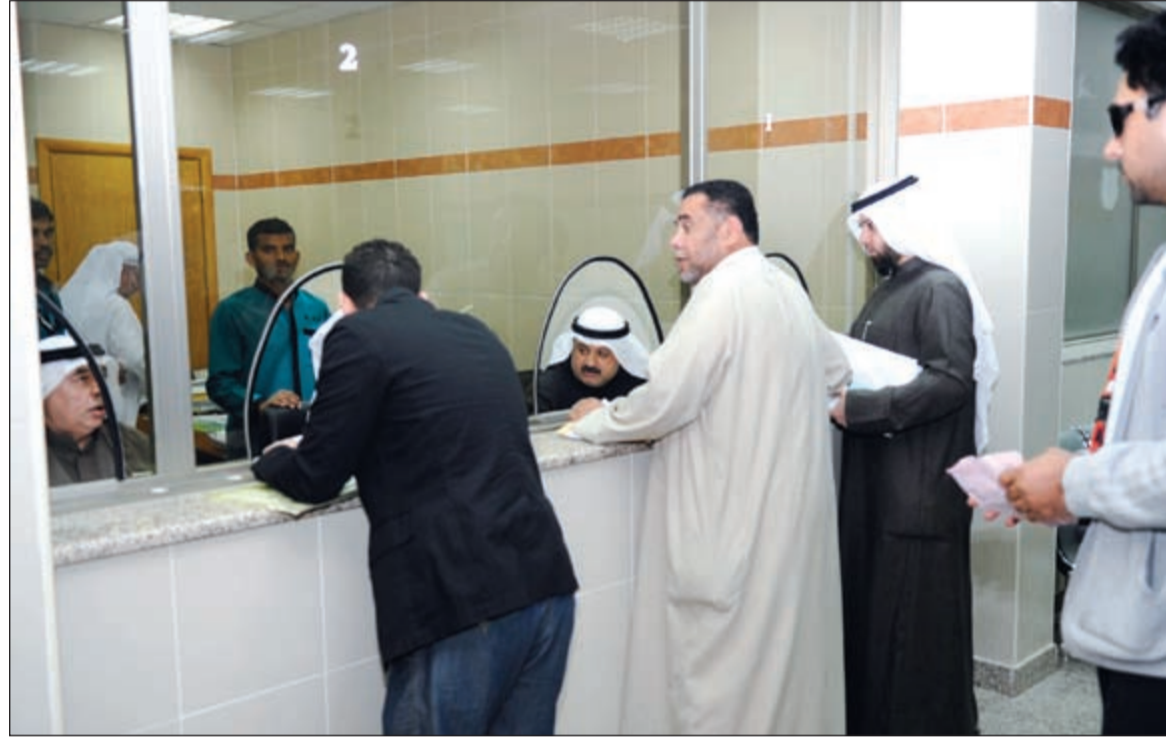
جانب من المراجعين لإصدار شهادات الميلاد