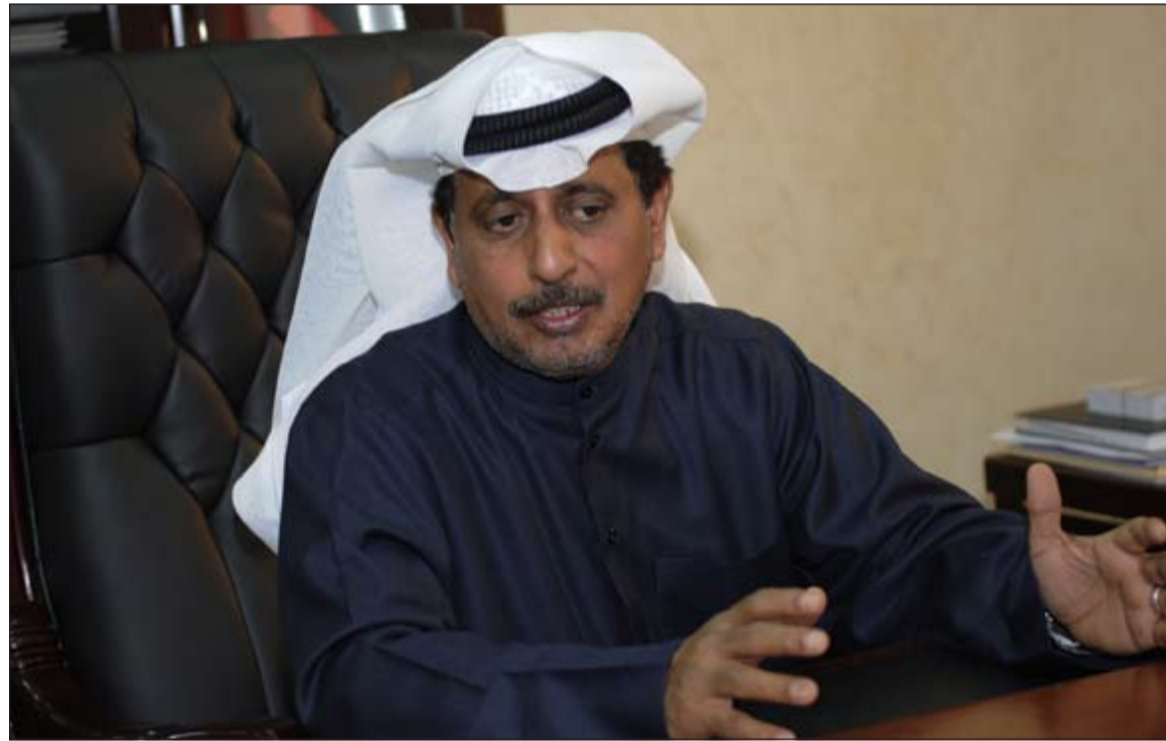
يتم إصدار شهادات ميلاد مجهولي الأب بناء على كتاب «الشؤون»

الميلاد أو الوفاة هو اعمال نصوص مواد قانون المواليد والوفيات.