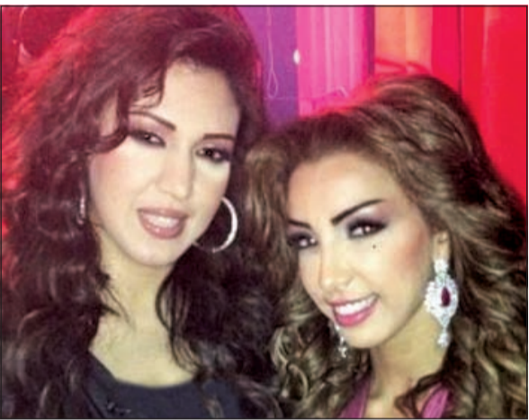
صورة لدنيا بطمة بعد عملية التجميل مع أسماء المنور

كليا عن الذي ظهرت به في «آراب أيدول»، وهو اللوك الذي لاقى استحسان و إعجاب متابعيها.