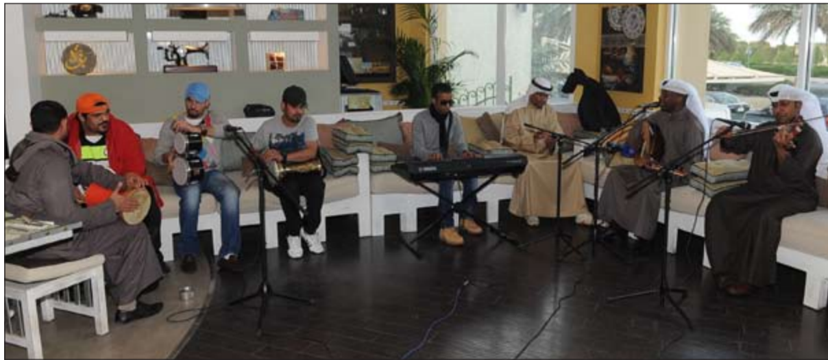
من أجواء حلقة «حزة القايلة» التراثية