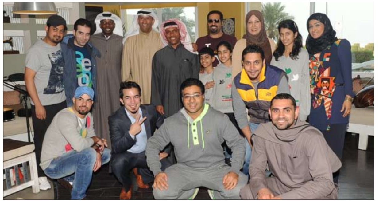
لقطة جماعية لأسرة «حزة القايلة» مع ضيوف الحلقة