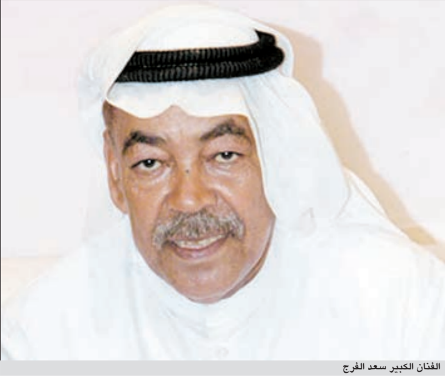
الفنان الكبير سعد الفرج

أو خجل، هذا تمثيل وسيناريو الاحداث فرض علينا ذلك، ان الضرورة الدرامية هي التي تقود المخرج والممثل وليس العكس. وهذا المسلسل تحديدا كانت المشاهد تدرس بعناية فائقة لإظهار المعاناة التي يعيشها بوكريم من اجل المحافظة على بناته السبع.» من جهة ثانية، أوضح الفرج ان حفل التكريم الذي أقيم له قبل أيام جاء بمناسبة فوزه بجائزة أفضل ممثل في مهرجان القاهرة السينمائي الاخير عن دوره في فيلم «تورا بورا»، وأنه أول فنان خليجي يفوز بالجائزة مشيراً الى انه كان متوقفاً هذا الفوز للرسالة التي حملها الفيلم بمحاربته للارهاب الذي مارسه إحدى الجماعات الإسلامية في أفغانستان، وان هذا النجاح يحسب لكل العناصر التي شاركت في الفيلم.