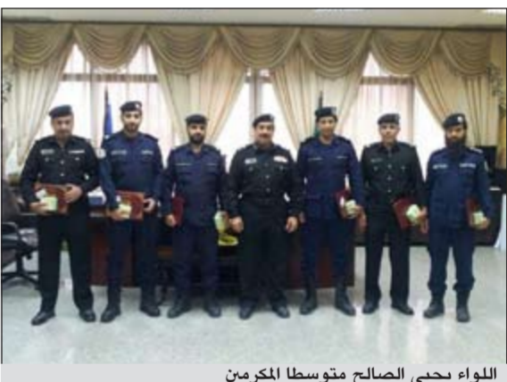
اللواء يحيى الصالح متوسطا المكرمين

بناء على توجيهات النائب الأول لرئيس مجلس الوزراء وزير الداخلية الشيخ أحمد الحمود، وتعليمات وكيل وزارة الداخلية الفريق غازي العمر بمكافأة المجد ليكون قدوة لزملائه، وبمناسبة يوم الشرطة العربية كرم مدير عام مديرية أمن محافظة مبارك الكبير اللواء يحيى الصالح عدداً من الضباط والأفراد منتسبي المديرية، وذلك لجهودهم المتميزة في أداء عملهم. وفي كلمة له بهذه المناسبة هنأ اللواء الصالح المكرمين مؤكداً لهم أن هذا التكريم يأتي نتيجة للسياسة التي تنتهجها وزارة الداخلية فسي تطبيق مبدأ تكريم المجد والمخلص من أبنائها وترسيخ قواعد العمل الأمني في البلاد، كما حثهم على مواصلة انانهم في العمل لتحقيق الأهداف المرجوة، مشيراً بذلك إلى أن حماية أمن الوطن لا تتجزأ وهي من أشرف وأنبغ الأعمال وهدفها توفير الأمن للجميع.