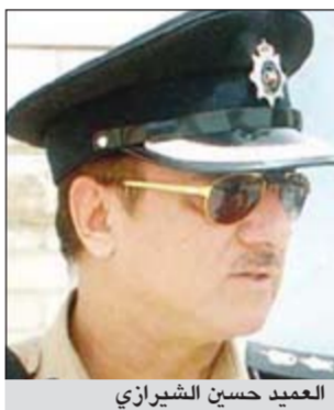
العميد حسين الشيرازي

حسين الشيرازي ويتفتيش جثة المجني عليه عثر معه على هويته وهاتفه النقال. وقال المصدر أن المجني عليه ليس من قاطني منطقة السرة بشأن وفاته والأرجح أن يكون هناك مجهول لقي بالجثة في هذه المنطقة وفر إلى جهة غير معلومة، هذا وانتقل مدير مباحث العاصمة العقيد منصور العتيبي وجار تحديد هوية