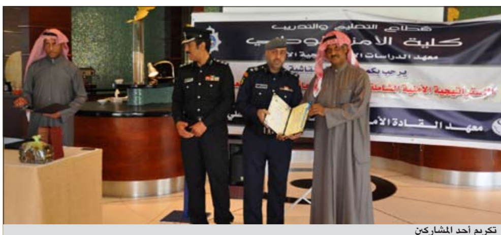
تكريم أحد المشاركين

عده محاور مهمة تتعلق بمفاهيم الأمن الوطني ومهددات الأمن الوطني المحلي ووسائل تحقيق