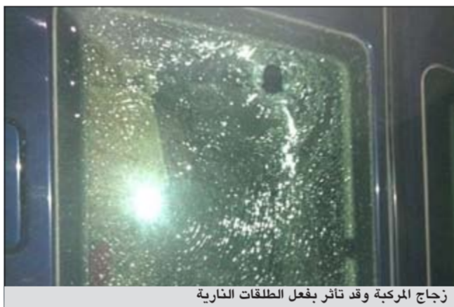
زجاج المركبة وقد تآثر بفعل الطلاقات النارية

كتبت النجاة أسرة كويتية تعرضت لإطلاق نار أثناء تواجدهم في مخيمهم الواقع على طريق الدائري السابع السريع مساء أمس الأول ولم يصب أحد من أفراد الأسرة بأي طلقه، بينما استقرت الطلاقات بسيارة العائلة التي تقدم الأب إلى مخفر الأحمدى مسجلاً قضية.