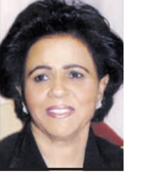
بفلم الشبيخة فريحة الأحمد الجابر رئيسة الجمعية الكويتية للأسرة المثالية