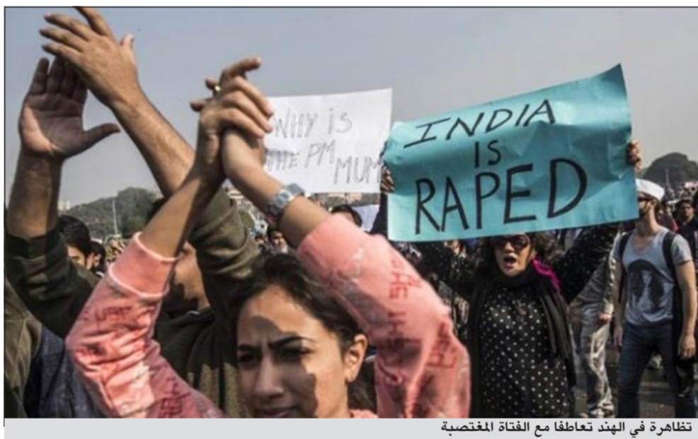
تظاهرة في الهند تعاطفا مع الفتاة المغتصبة

رجال في 16 ديسمبر في حافلة ثم قاموا بضربها بفضيب من حديد وألقوها من الحافلة.