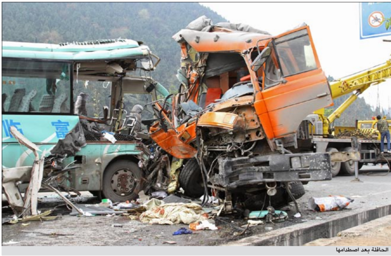
الحافلة بعد اصطدامها

والأشخاص الذين تابعوا دروساً على الإنترنت يتقاضون أجوراً عالية هم الأكثر ميلاً إلى القراءة الرقمية وكذلك البالغين بين سن الثلاثين والتاسعة الأربعين على ما لفت مركز بيو الذي أجرى هذا الاستطلاع بين 15 أكتوبر والعاشر من نوفمبر.