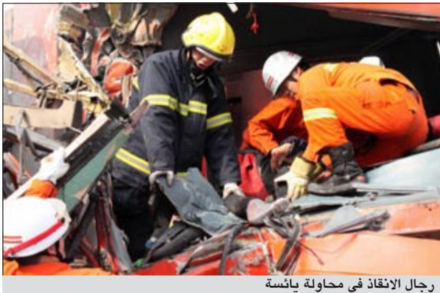
رجال الإنقاذ في محاولة يائسة

ووسائل النقل في ريف الصين محفوفة بالمخاطر حيث الحافلات والشاحنات مهالكة ولا تخضع للصيانة اللازمة ويجري تجاهل القواعد المرورية على نطاق واسع.