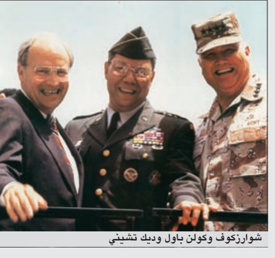
شوارزكوف وكولين باول وديك تشيني