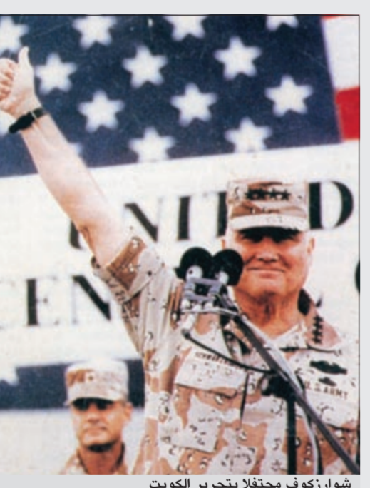
شوارزكوف محققاً بتحرير الكويت