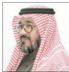
بقلم: يوسف عبدالرحمن

ولتبقى المقولة الشعبية: الابن سر أبيه، ويبقى لنا ريحك الطيب في ابتناك فلاح وإخوانه، إنا له وإنا إليه راجعون.