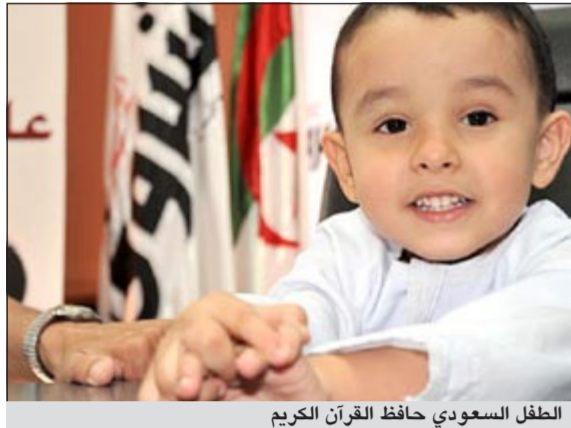
الطفل السعودي حافظ القرآن الكريم