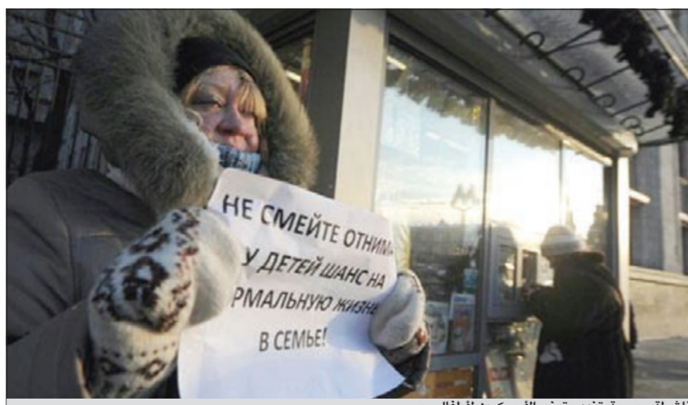
ناشطة روسية تندد بتبني الأميركيين لأطفال روس

أوباما في 14 ديسمبر يدعي «قانون ماغنيتسكي»، الذي يفرض قيوداً على الأموال والسفر ضد منتهكي حقوق الإنسان في روسيا خلال الفترة من عام 1999 إلى 2011.