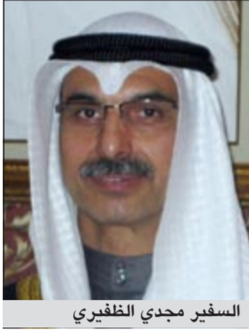
السفير مجدي الظفيري

وأوضح السفير الظفيري في تصريح له «كونا» ان صاحب السمو الأمير الشيخ صباح الأحمد امر السفارة بالتحرك فوراً للاطمئنان على سلامة المواطنين العالقين والعمل فوراً على توفير وتسهيل الإقامة لهم.