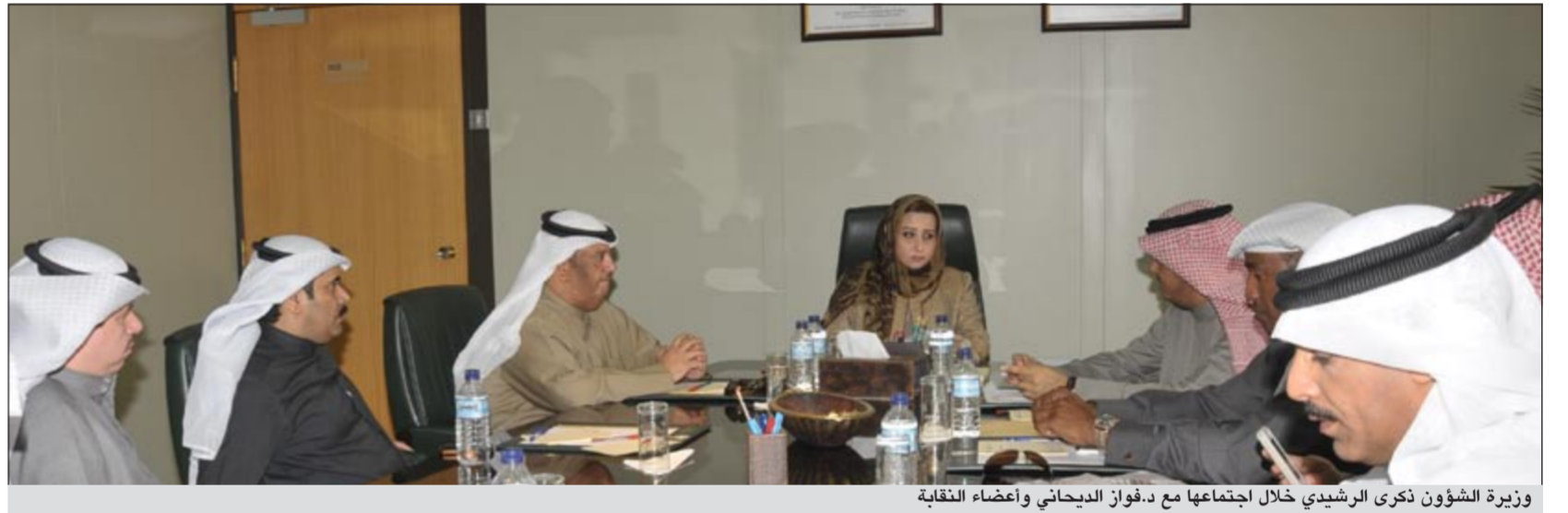
وزيرة الشؤون ذكرى الرشيدى خلال اجتماعها مع د.فواز الديحاني وأعضاء النقابة

أكدت وزيرة الشؤون ذكرى الرشيدى أن حقوق العاملين في الوزارة لن تضيع وأنها تسعى إلى إعطاء كل ذي حق حقه، مشيرة إلى أنها استمعت إلى نقابة الشؤون في اجتماع عقده صباح امس واستمعت إلى مطالب النقابة وستسعى إلى الاستجابة إلى تلك المطالب وفقاً للقوانين المعمول بها في الدولة وديوان الخدمة المدنية.