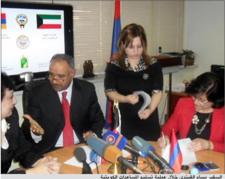
السفير بسام القبدي خلال عملية تسليم المساعدات الكويتية

يريفان - كونا: قام سفيرنا لدى جمهورية أرمينيا بسام القبدي بتسليم المساعدات الكويتية للنازحين السوريين في الجمهورية الأرمينية.