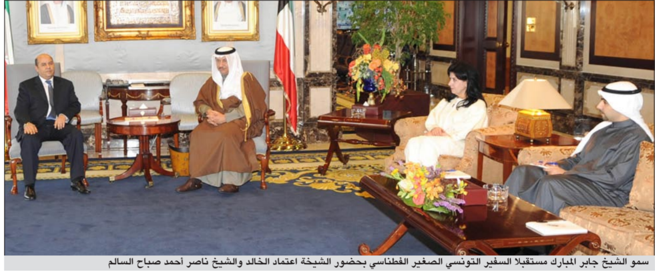
سمو الشيخ جابر المبارك مستقبلاً السفير التونسي الصغير الفطناسي بحضور الشيخة اعتماد الخالد والشيخ ناصر أحمد صباح السالم

استقبل سمو رئيس مجلس الوزراء الشيخ جابر المبارك في قصر السيف امس كلا على حدة سفير جمهورية النمسا السفير اولريخ فرانك وسفير اليابان السفير توشيهيرو تسويهيرا وسفير الجمهورية التونسية السفير الصغير الفطناسي بمناسبة تسلم مهام عملهم لدى الكويت.