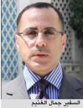
السفير جمال الغنيم

وأضاف الغنيم في تصريح له «كونا» امس ان هذه المبادرة الكريمة التي تستضيفها الكويت لمناقشة تقديم المساعدات الإنسانية التي يحتاجها الشعب السوري لاقت كذلك صدى ايجابيا كبيرا لدى جامعة الدول العربية ومسؤوليها. وذكر انه بحث مع الأمين العام للجامعة د.نبيل العربي وكبار مساعديه أبعاد هذه المبادرة ومضامينها الإنسانية السامية التي تكتسب أهمية كبيرة في الوقت الراهن خاصة في ضوء التحذيرات