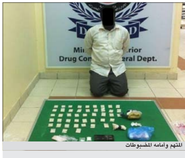
المتهم وامامه المضبوطات