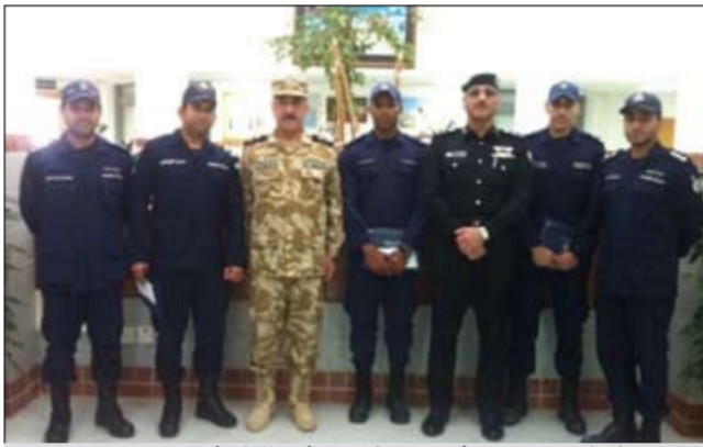
اللواء الشيخ محمد اليوسف كرم المشاركين في إنقاذ الفتاة

الفتاة الهرب مقاومة رجال خفر السواحل، وتم إنقاذها وتسليمها