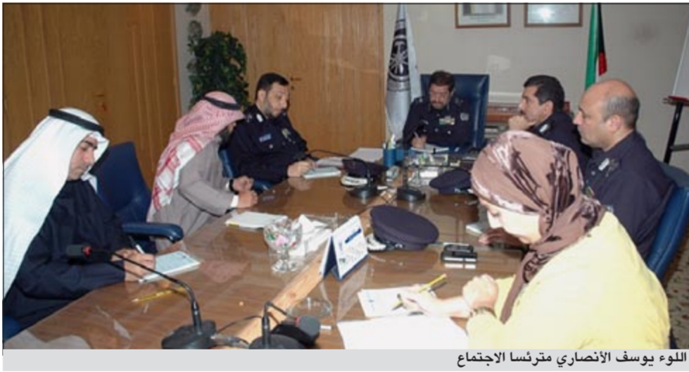
اللواء يوسف الأنصاري مترئسا الاجتماع

الرئيس الأعلى لجهاز الإطفاء الشيخ محمد عبدالله المبارك الصباح - وزير الدولة لشؤون مجلس الوزراء في سبيل إقرار تلك البدلات وهو ما أثنى عليه الحضور، وفي نهاية الاجتماع اتفق الحضور على عقد لقاءات دورية بمشاركة ممثلين عن الفئات