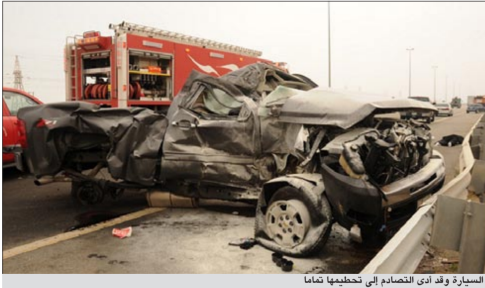
السيارة وقد أدى التصادم إلى تحطيمها تماما