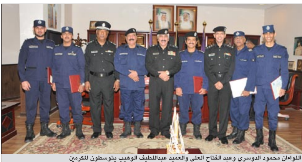
اللواءان محمود الدوسري وعبد الفتاح العلي والعميد عبداللطيف الوهيب يتوسطون المكرمين

الكويت وأن يبذلوا جهودهم على مدار الساعة لحفظ الأمن والأمان.