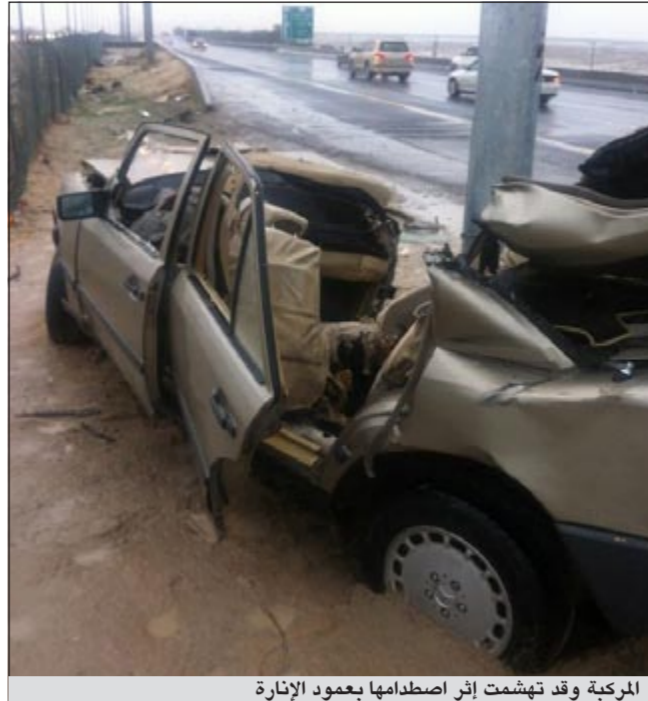
المركبة وقد تهشمت إثر اصطدامها بعمود الإنارة