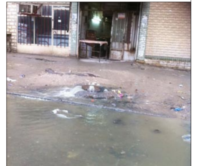
المجارير طفحت امس في منطقة الجليلب