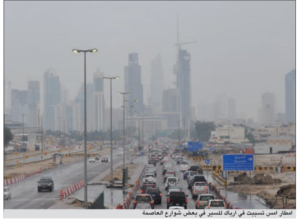
امطار امس تسببت في ارباك للسير في بعض شوارع العاصمة