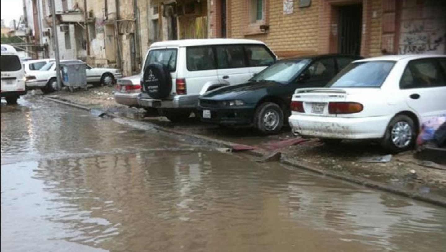
شوارع الجليلب كما بدت امس بعد الامطار

الأنصاري: توزيع الفرق على الأماكن الحرجة العلي: نستخدم التناكر لسحب وشفط المياه من مواقع التجمع