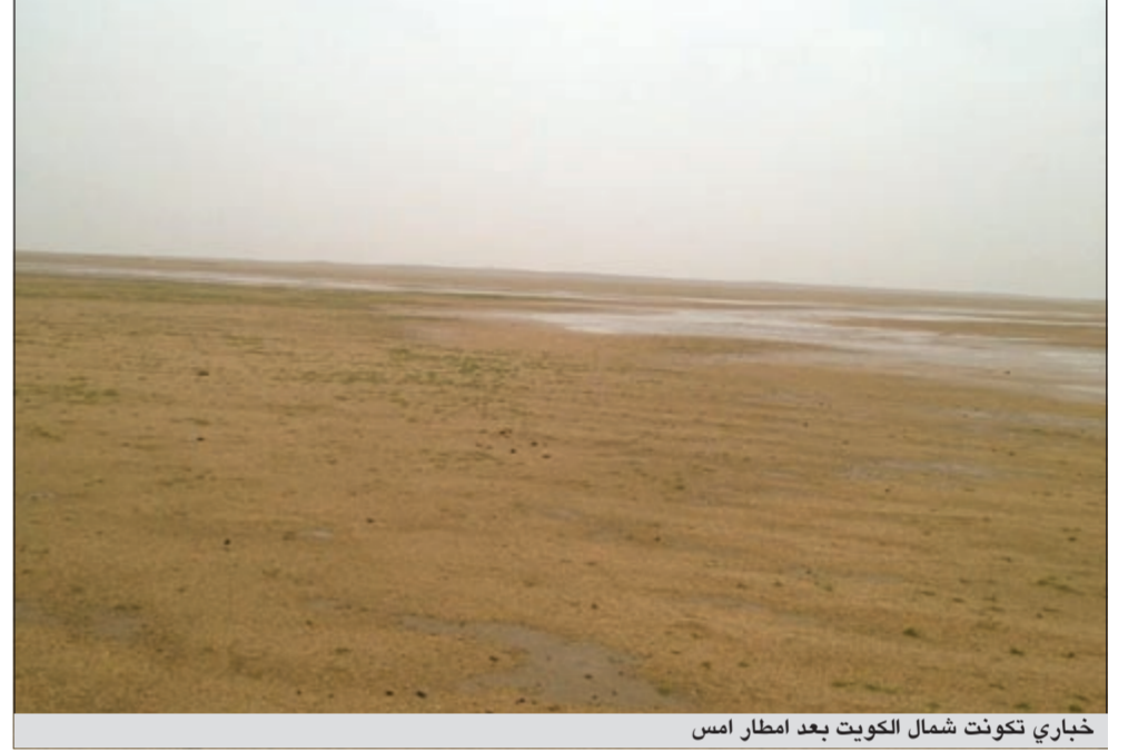
خباري تكدت شمال الكويت بعد امطار امس