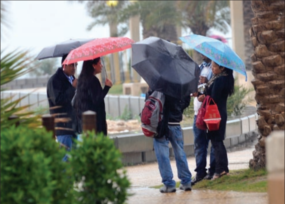
حديث تحت المطر (مقنن غوزال)

أكد العالم الفلكي د. صالح العجيري أن الربيع سيحل مبكراً هذا العام، مشيراً إلى أن كمية الأمطار التي شهدتها البلاد خلال الفترة الماضية تنبئ بربيع خير لهذا العام، وقال د. العجيري تعليقا على الأمطار الغزيرة التي شهدتها البلاد طوال يوم أمس: تسمى هذه الأمطار بأمطار الربيعانية، خاصة أنها تأتي في موسم الربيعانية الذي عادة ما يشهد درجة حرارة متدنية ولنمس معه البرد الشديد، غير أن موسم الربيعانية هذا العام جاء مختلفاً ورياحه الشمالية كانت محملة بالرطوبة، لذا غلب على معظم فتراته الدفء واجواء غائمة وأمطار غزيرة، وينتظر أن يستمر المطر ولكن بدرجة أخف اليوم، على أن تنقشع الغيوم غداً الخميس وتتحوّل الرياح إلى شمالية ومعها تنخفض درجات الحرارة ونشعر بالبرد الشديد.