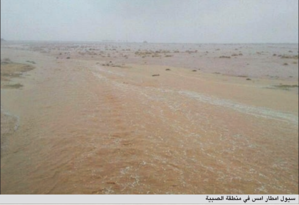
سيول امطار امس في منطقة الصبية