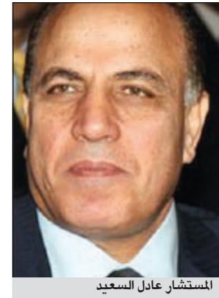
المستشار عادل السعيد

من جهة أخرى، أصدر المستشار طلعت عبدالله النائب العام قرارا بإنهاء نذب المستشار عادل السعيد رئيس المكتب الفني على أن يعود لممارسة عمله بالقضاء.