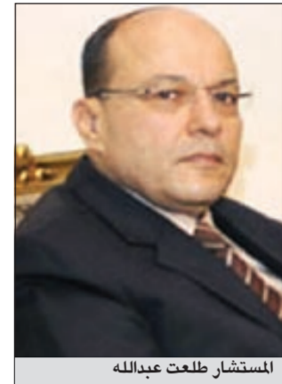
المستشار طلعت عبدالله

أكد النائب العام المستشار طلعت إبراهيم عبدالله، أن الأزمة الحقيقية التي واجهته منذ توليه مهام عمله وحتى الآن، هي تعليق العمل بالنيابات وخروج عدد كبير من قيادات النيابة العامة مطالبين بإنهاء انتدابهم بالنيابة والعمل بالقضاء، وأنه يحاول جاهدا انتداب فريق آخر من التفتيش القضائي أو القضاء للعمل بمكتبه وتوزيعهم للعمل بالنيابات الشاغرة.