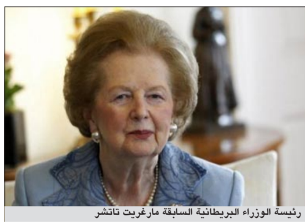
رئيسة الوزراء البريطانية السابقة مارغريت تاتشر

لإزالة نتوء في الخانة. ويشار إلى أن تاتشر التي شغلت منصب رئيسة وزراء بريطانيا 1979 - 1990 لم تظهر أمام وسائل الإعلام كثيرا منذ أن أصيبت بسلسلة من السكتات الدماغية عام 2002. وقد نصحتها الأطباء منذ ذلك الوقت بعدم الإدلاء بخطابات عامة.