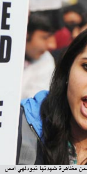
فتاة هندية تحمل لافتة احتجاجية ضمن مظاهرة شهدت نيودلهي أمس

وهذا الارتفاع هو أشد بمرتين من التقديرات، وهو أكبر بثلاث مرات من معدل الارتفاع الذي سجل على سطح الأرض خلال الفترة عينها، على ما أفاد دافيد برومويتش أحد القيمين على هذه الدراسة