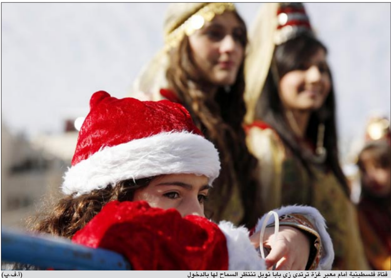
فتاة فلسطينية أمام معبر غزة ترتدي زي بابا نويل تنتظر السماح لها بالدخول

مدارس تديرها حكومة حماس وبعضهم في مدارس خاصة تديرها أونروا (منظمة الأمم المتحدة لتسهيل الفلسطينيين) في غزة. ولا يتردد حديث علني عن تعرضهم لأي تمييز.