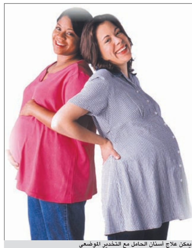
يمكن علاج أسنان الحامل مع التخدير الموضعي