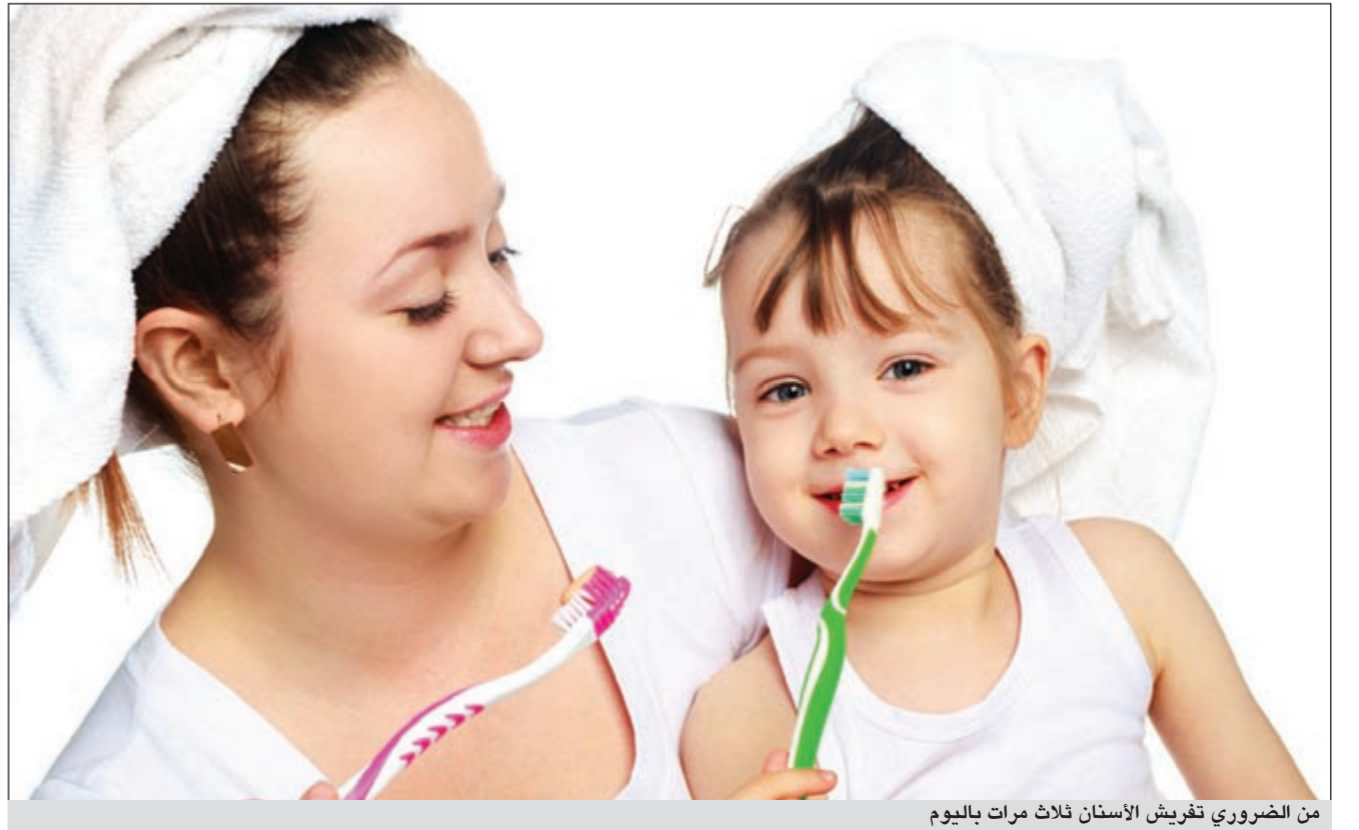
من الضروري تفريش الأسنان ثلاث مرات باليوم