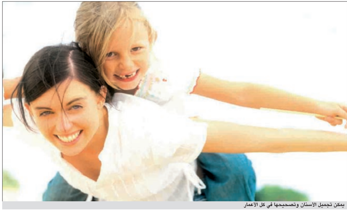
يمكن تجميل الأسنان وتصحيحها في كل الأعمار

تجميل الأسنان وتصحيحها يتم في كل الأعمار أما تبييض الأسنان فلا يجري قبل 16 سنة